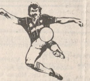
μαυροί» ικανοποίησαν στην πρώτη τους εμφάνιση και θα μπορούσαν να σημειώσουν ευρύ σκορ εάν ήταν λίγο πιο τυχεροί στην τελική προσπάθεια.

Με επιτυχία άρχισε τους φιλικούς αγώνες της η ΑΕΚ κερδίζοντας στο γήπεδό της τα Ανάγεια με σκορ 1-0.