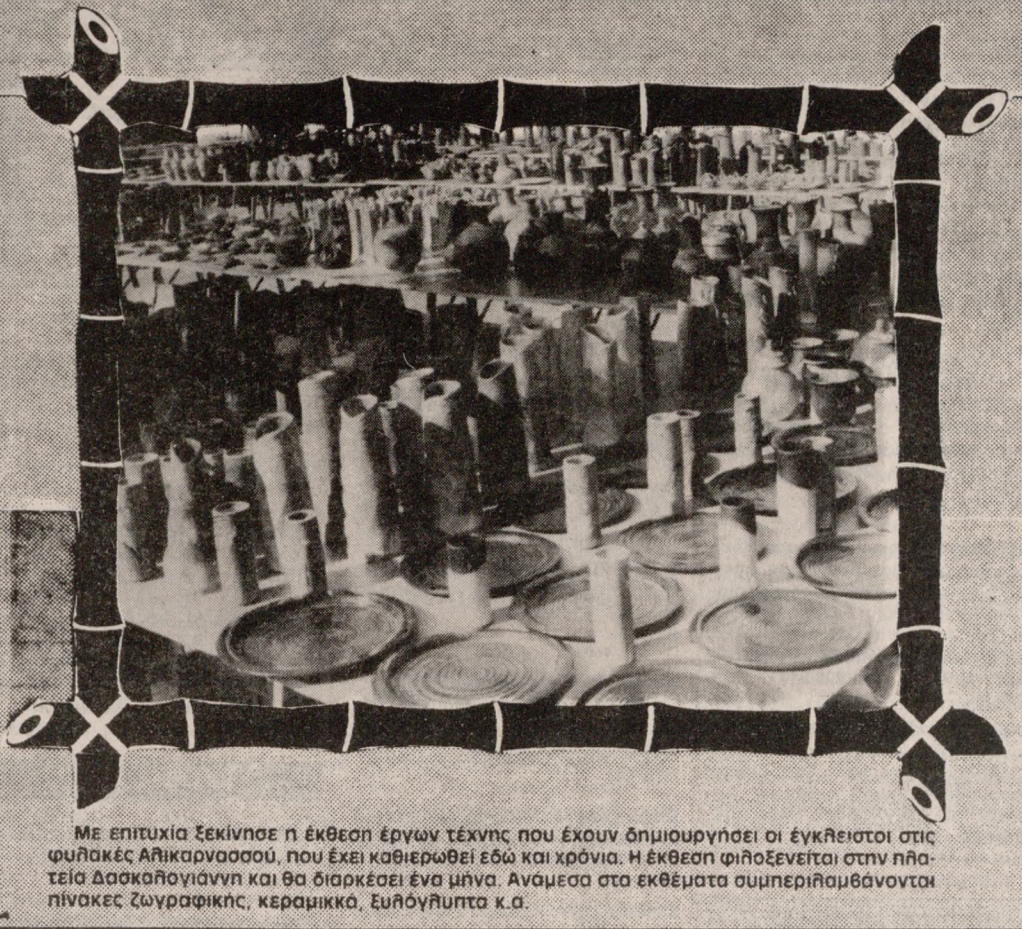
Με επιτυχία ξεκίνησε η έκθεση έργων τέχνης που έχουν δημιουργήσει οι εγκλωβιστοί στις φυλακές Αθήκων, που έχει καθιερωθεί εδώ και χρόνια. Η έκθεση φιλοξενείται στην πλατεία Δασκαλογιάννη και θα διαρκέσει ένα μήνα. Ανήκει στα εκθέματα συμπεριλαμβανόμενα της ζωγραφικής, κεραμικά, ξυλόγλυπτα κ.α.