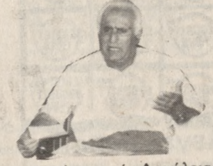
μέας της Αγροτικής Ασφάλειας και να αρθούν παράπονα των αγροτών.