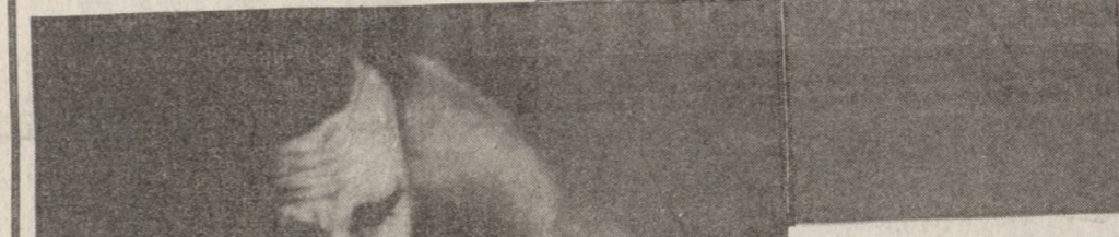
Ντάνιελ Ντέ Λιούις και Λένα Ολιν στη θαυμάσια «Αβάσταχη ελαφρότητα του είναι».