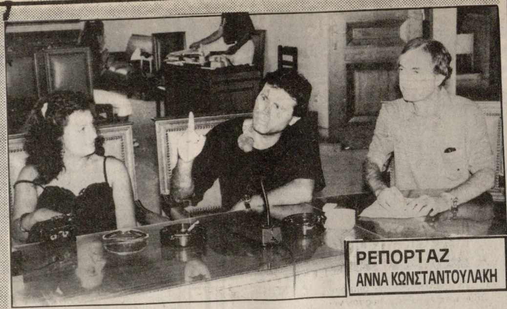
REPORTAZ ANNA KONSTANTOYLAKI

δοχείο «Καψής» στην Αγία Πελαγία κατά τη διάρκεια Παγκόσμιου Ιατρικού Συνεδρίου.