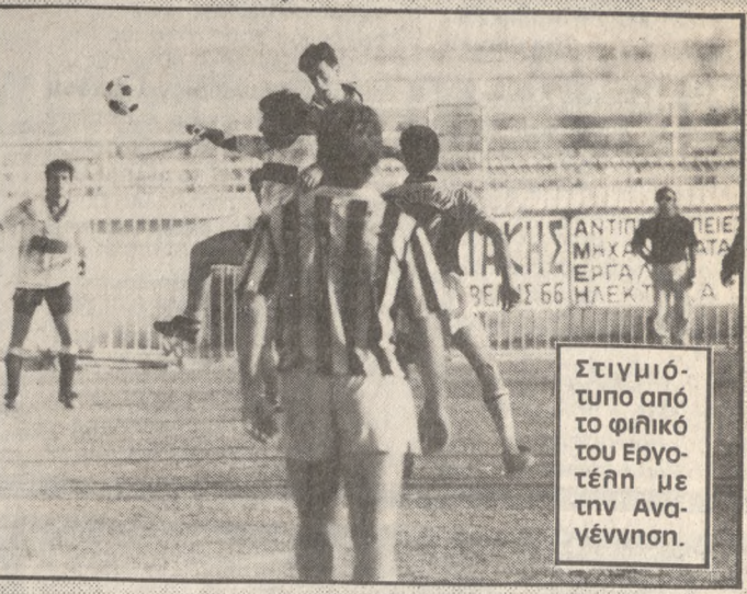
Στιγμιότυπο από το φιλικό του Εργοτέλη με την Αναγέννηση.