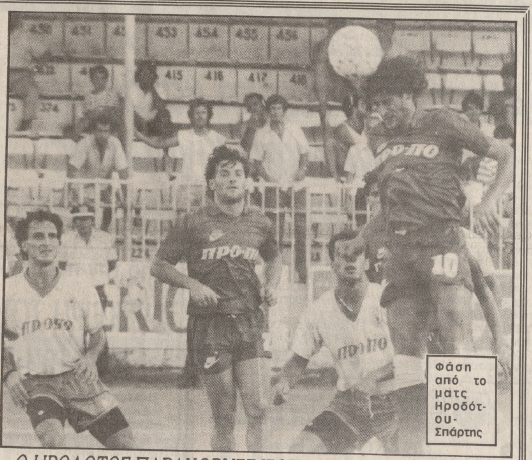
Ο ΗΡΟΔΟΤΟΣ ΠΑΡΑΧΩΡΗΣΕ ΙΣΟΠΑΛΙΑ (1-1) ΣΤΗ ΣΠΑΡΤΗ

ΔΥΟ μπασκετμπολίστες από την Σάμο πήρε ο Κύδων. Πρόκειται για τους Τσιάκαλο και Νιαδή , που αποδεσμεύθηκαν. ΕΞΑΛΛΟΥ ο Κολοσσός πήρε από την Σάμο τον Λυμπερή , με αποδόσευσή.