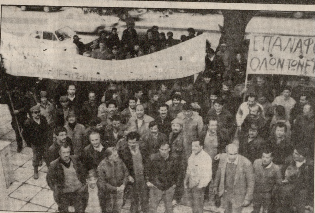
Πέρα από τα γενικά αυτά θέματα σε τοπικό επίπεδο απαιτούνται οι παρακάτω ενέργειες από την πλευρά σας.

Η μονιμοποίηση των υπαλλήλων του Δημοσίου και των ΟΤΑ δεν μπορεί και δεν πρέπει να μπαίνει στη ζυγαριά των κομματικών ανταγωνισμών και στην διεκδικασία των αντιπαραθέσεων. Η Διοίκηση του ΕΚΗ σύμφωνα όπωσ στα προαναφερόμενα θέματα διεκδικεί την μονιμοποίηση θεωρώντας απαραίτητο να γίνεται καπνεία του δικαιώματος για εξασφάλιση της εργασίας.