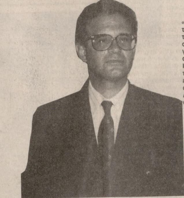
«Σεβασμιώτατε τη βοήθειά σας για τα σχολεία». Κάτι τέτοιο είπε χθες στον Αρχιεπίσκοπο ο Νομάρχης

Ο Νομάρχης πρόσθεσε πως γίνεται προσπάθεια να μετατραπεί σε κοινωνικό πρόβλημα του νομού το κτι-