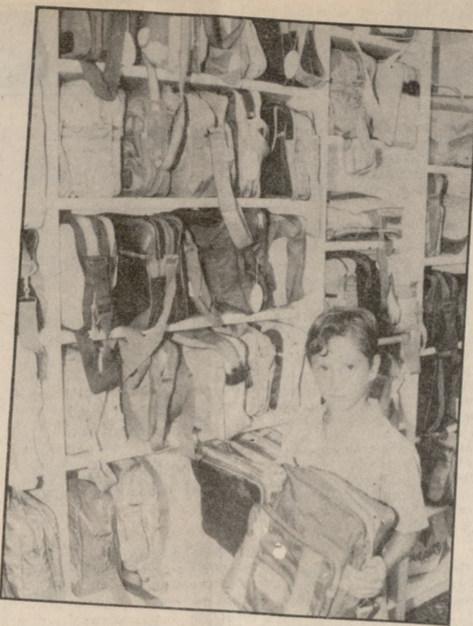
Την βρήκε την τσάντα του!

μέγ ενός τετραδίου με σχέδια και χρώμα φθάνει τις 150 δρχ. Οι σχολικές τσάντες ξεκινούν από 2000 περίπου και φθάνουν τις 8.000 ή και περισσότερο ανάλογα με τη φίρμα τους. Ένας μαθητής χρειάζεται μέσο όρο από οκτώ μέχρι δέκα περίπου χιλιάδες δραχμές προκειμένου να αγοράσει τα απαραίτητα σχολικά είδη και το ποσό αυτό ανεβαίνει ή μειώνεται, ανάλογα με τις «απαιτήσεις» του μικρού αγοραστή που συχνά δεν συμβαδίζουν με τις διαθέσιμες των γονιών του... Σύμφωνα με τις εκτιμήσεις του κ. Μαστοράκης, Διευθυντή Εμπορίου της Νομαρχίας, τα σχολικά είδη βρίσκονται κάτω από αγορανομικό έλεγχο και έχουν διατιμηθεί γύρω στο 40%. Τα άλλα είδη, όπως τσάντες πολυτελείας έχουν φθάσει σ' ένα ποσοστό κέρδους 80% και πωλούνται ελεύθερα.