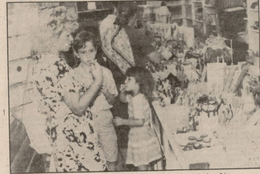
Στις προθήκες των βιβλιοπωλείων προς αναζήτηση σχολικών ειδών