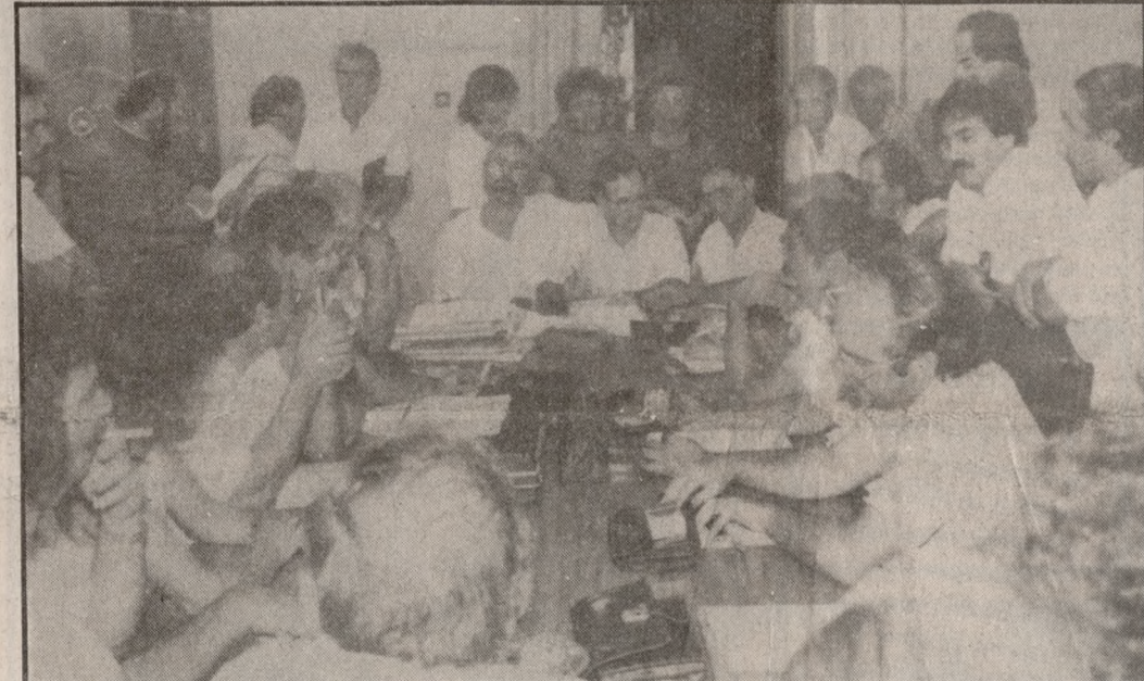
Αποδοτική η χθεσινή σύσκεψη για το θέμα των λατομείων της περιοχής Ελιάς.

στιτούτου Γεωλογικών Μεταλλευτικών Ερευνών που θα ελέγχει την πλήρη εφαρμογή απ' τα υπόλοιπα λατομεία, των νόμων και των κανόνων υγιεινής και ασφάλειας. Σε περίπτωση διαπίστωσης παραβάσεων η επιτροπή θα κάνει την εισήγηση στο Νομάρχη για τα μέτρα που πρέπει να ληφθούν. Μπορεί να είναι και ανάκληση της άδειας. Παράλληλα η επιτροπή θα ερευνήσει το νομό για την επιλογή νέων κατάλληλων λατομικών ζωνών, όπου τα λατομεία θα μεταφερθούν και θα λειτουργήσουν. Το χρονικό διάστημα θα το ορίσει η ίδια, που επίσης θα έχει την ευθύνη να ελέγχει τη σωστή τροφοδοσία της αγοράς με λατομικά υλικά. Την πρόταση αυτή του Νομάρχη δέχθηκαν οι εκπρόσωποι των Κοινοτήτων και των φορέ-