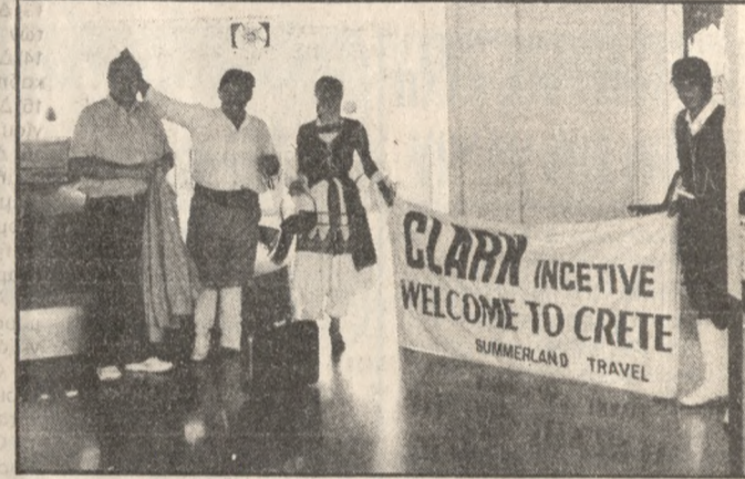
δα. κ. Κοντέλη Στο αεροδρόμιο οργανώθηκε υποδοχή ανάμεσα της Κρητικής φιλοξενίας από τους οργανωτές του ταξιδιού τους, «SUMMERLAND TRAVEL» των Αφών Βλατάκη.

Για άλλη μία φορά η Κρήτη με τις μαγευτικές φυσικές ομορφίες προσελκύει ξένους επισκέπτες οι οποίοι επιλεκτικά έρχονται για να χαρούν το καλοκαίρι. Έτσι την Κρήτη και συγκεκριμένα τα μαγευτικά μπάνγκαλος πάνω στην θάλασσα του Ξενοδοχείου ELOUNDA BEACH διαλέξε η μεγαλύτερη πολυεθνική εταιρία περονόφορων οχημάτων CLARK, για να φιλοξενήσει τους περισσότερους επιτυχημένους αντιπροσώπους της στην Ευρώπη, συμπεριλαμβανομένων και του αντιπροσώπου τους στην Ελλάδα. Στο αεροδρόμιο οργανώθηκε υποδοχή ανάμεσα της Κρητικής φιλοξενίας από τους οργανωτές του ταξιδιού τους, «SUMMERLAND TRAVEL» των Αφών Βλατάκη. Αξίζουν συγχαρητήρια στους οργανωτές της υποδοχής αφού με τον τρόπο που επέλεξαν για να υποδεχθούν τους ξένους επισκέπτες μας συνέβαλαν και στην προβολή της Κρητικής παράδοσης.