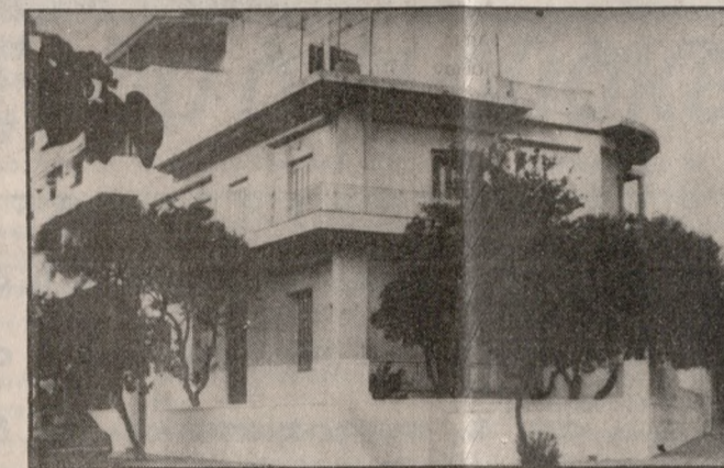
Το νέο κτίριο της Στέγης Ανηλικών.

Ολοκληρώνονται αύριο οι εργασίες στο δημοτικό κτίριο της οδού Παπανδρέου και Ακαδημίας όπου θα μεταστεγασθεί η Στέγη Ανηλικών. Αμέσως αναμένεται να αρχίσει και η μεταφορά της στέγης στο κτίριο, ενώ παράλληλα στο παλιό κτίριο θα αρχίσει τμηματικά η μετεγκατάσταση του 16ου Δημοτικού Σχολείου.