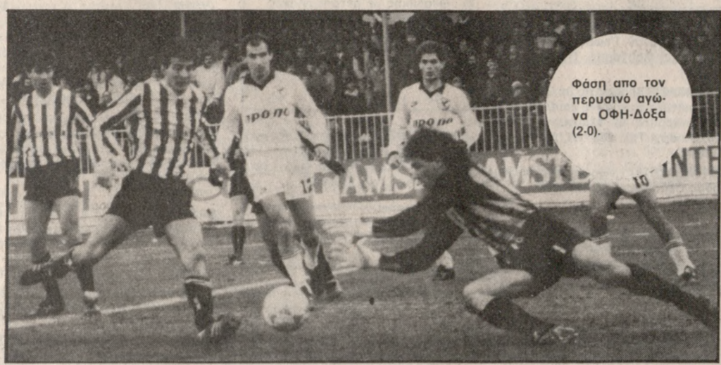
Φάση από τον περσινο αγώνα ΟΦΗ-Δόξα (2-0).