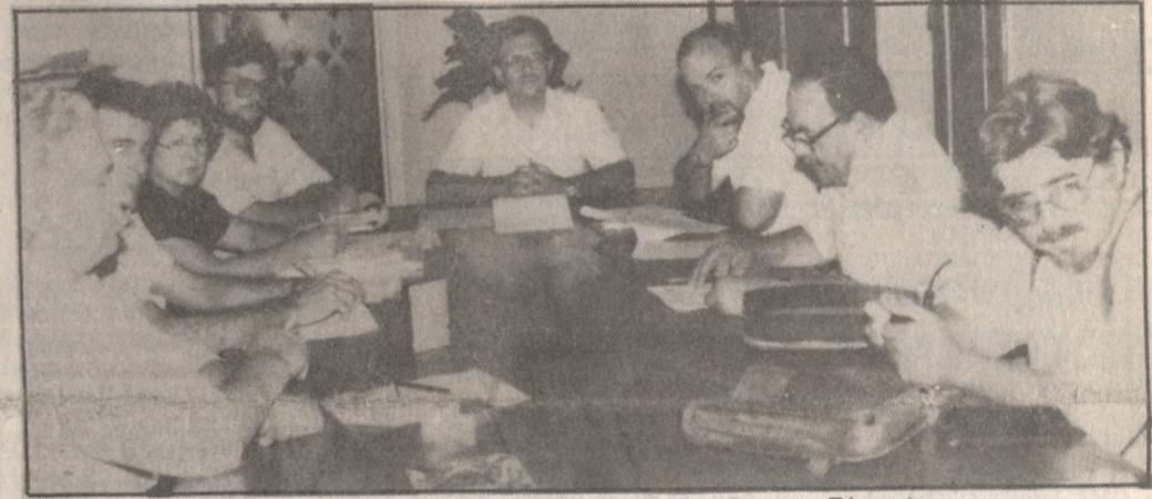
Εκπρόσωποι των Κομμάτων με το Νομάρχη χθες στη Σύσκεψη

Προσπάθεια να εγγυηθούν τα ίδια τα κόμματα τη διεξαγωγή ενός ήπιου και κυρίως πολιτικού προεκλογικού αγώνα ξεκίνησε χθες στο νομό με πρωτοβουλία του Νομάρχη Δημήτρη Κουνενάκη. Το σημαντικό είναι ότι στη χθεσινή πρώτη τους συνάντηση οι εκπρόσωποι των πολιτικών κομμάτων είδαν την ανάγκη διαμόρφωσης ενός εντελώς διαφορετικού προεκλογικού κλίματος απ' αυτό το τόσο βεβαρημένο, οξυμένο και φανατισμένο του περασμένου Ιουλίου.