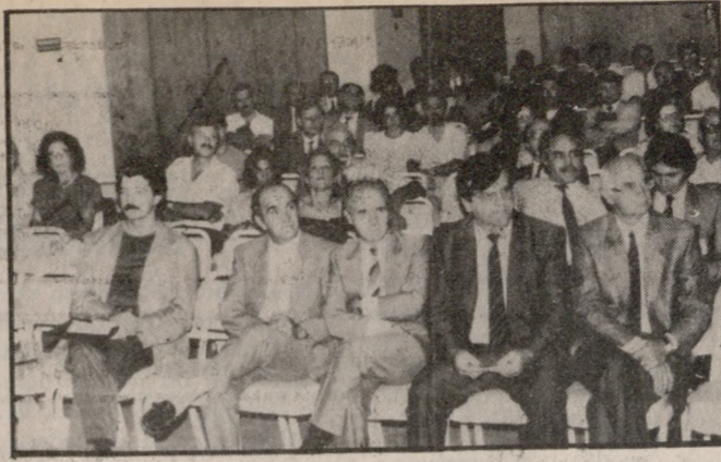
ΛΗΓΕΙ ΤΟ ΣΥΝΕΔΡΙΟ ΠΑΡΕΝΤΕΡΙΚΗΣ

Είναι ενδιαφέρον να σημειωθεί ότι η ΑΣΠΕ αποτελείται από 55.000 οικογένειες σε όλη την Ελλάδα, ιδιαίτερα δε στην Κρήτη η πολυτεκνία έχει παράδοση. Έτσι το Νπσί πρωτοστατεί και σ' αυτό το κρέος που πρέπει να θεωρείται και εθνικό.