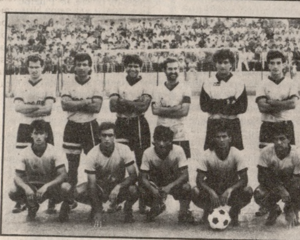
Η 11άδα του ΠΑΝΟΜ που νίκησε 1-0 την Θήβα.

ΣΗΜΕΡΑ στις 4 το απόγευμα στην Ιεράπετρα θα γίνει ο εξ αναβολής αγώνας του Κυπέλλου μπάσκετ της ΕΚΑΣΚ μεταξύ του Λιβυκού και του ΟΦΗ.