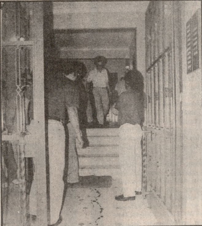
Το εσωτερικό της εισόδου στην πολυκατοικία όπου ο Παύλος Μπακογιάννης δέχθηκε την επίθεση των εκτελεστών της «17 Ν»

ΚΑΙΝΙΚΑ ΝΕΚΡΟΣ ΣΤΟΝ ΕΥΑΓΓΕΛΙΣΜΟ Δραματικές σκηνές έζησαν όσοι βρέθηκαν στο νοσοκομείο Ευαγγελισμού αμέσως μετά τη γνωστοποίηση του τραυματισμού του βουλευτή Παύλου Μπακογιάννη.