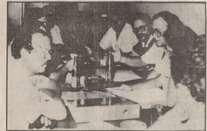
Λούκετο σε δύο λατομεία αποφάσισε η επιτροπή.

Οι εργολάβοι ή υπεργολάβοι οικοδομικών έργων, εφόσον κατά το έτος 1988 απασχολήσαν, έστω μια φορά, περισσότερους απο τρεις (3) μισθωτούς. Όσοι επιδοτούνται λόγω τακτικής ανεργίας και ειδικού επι-