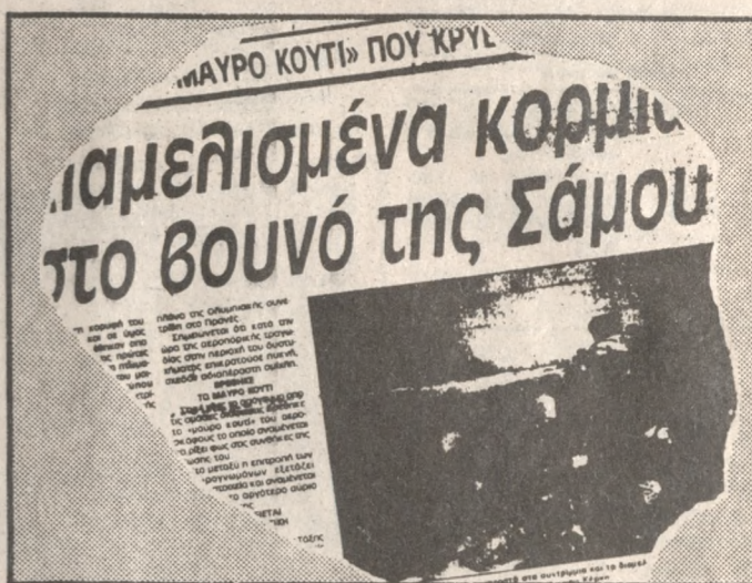
Η Ολυμπιακή πληρώνει το ΛΑΘΟΣ του πιλότου

Καμία αποζημίωση στους συγγενείς των θυμάτων της αεροπορικής τραγωδίας στη Σάμο δεν πρόκειται να δώσει σύμφωνα με αποκλειστικές πληροφορίες της «Π» η αγγλική ασφαλιστική εταιρία