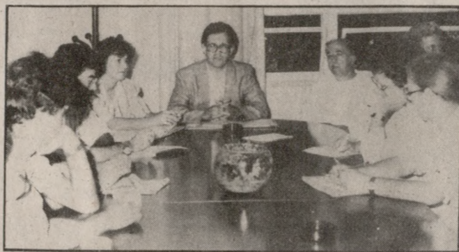
Ο Νομάρχης Ηρακλείου ενημερώνεται για τα προβλήματα του Βενιζελείου.

«Μας ενδιαφέρει να μπει έστω και ένα λιθαράκι σ' αυτό το έργο» τόνισαν οι εκπρόσωποι του Δ.Σ. που δεν έκρυβαν την ανησυχία τους για την καθυστέρηση της υπογραφής της β' φάσης της μελέτης επέκτασης η οποία βρίσκεται ήδη στα χέρια των τεχνικών υπηρεσιών.