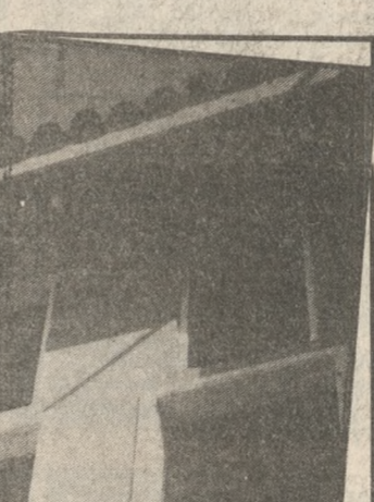
και της Κρήτης». Η πρόταση της μεταφοράς του Τουρκικού Αρχείου συζητήθηκε χθες το βράδυ στο Δημοτικό Συμβούλιο.