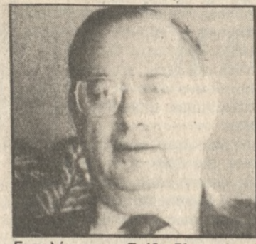
Εντολή στον κ. Γρίβα δίνει σήμερα ο κ. Σαρτζετάκης.

Τον σχηματισμό υπηρεσιακής κυβέρνησης στον Πρόεδρο του Αρείου Πάγου κ. Γρίβα αναθέτει σήμερα ο πρόεδρος της Δημοκρατίας κ. Χρήστος Σαρτζετάκης. Αυτή ήταν και η λύση στην οποία συμφώνησαν στη διάρκεια της χθεσινής σύσκευσης με τον πρόεδρο της Δημοκρατίας οι τρεις πολιτικοί αρχηγοί οι οποίοι απέκλεισαν τον σχηματισμό Οικουμενικής Κυβέρνησης.