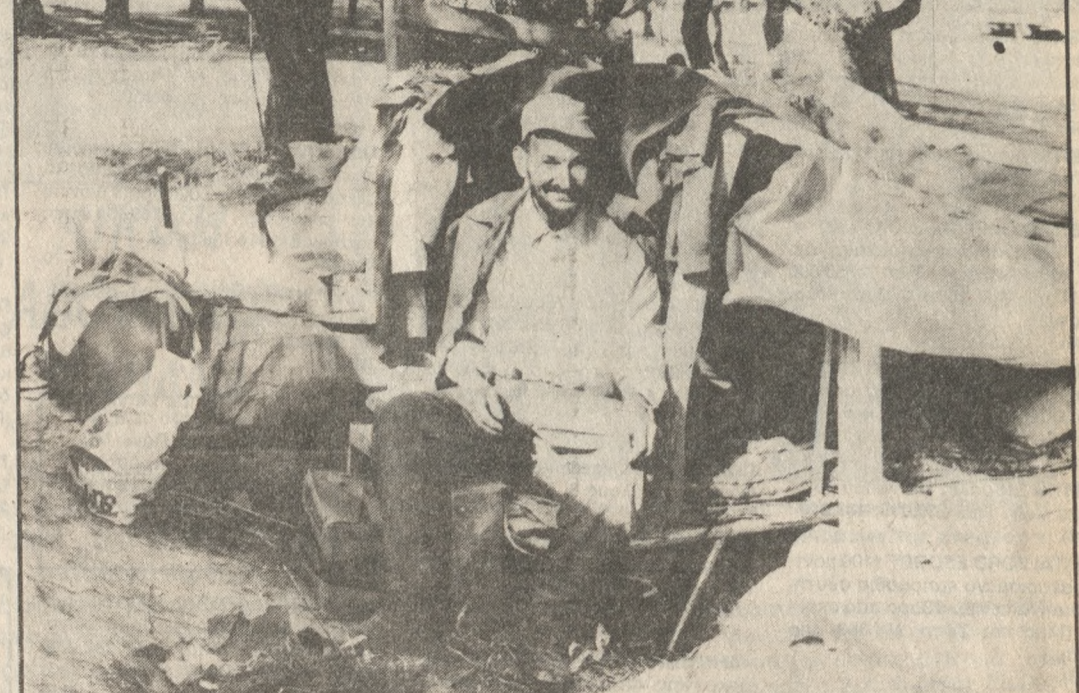
Μόνος και έρημος μέσα στην αθλιότητά του... «Π» πάντως καταγράφει το γεγονός και είναι σειρά πλέον των αθλοδρόμων να αποφασίσουν για τη τύχη του 59χρονου.

Στο κατώφλι του 1992 και του 2000 σε μια εποχή που η επιστήμη και η τεχνολογία έχουν κάνει κομμάτι ψωμί και ένα πιάτο φαγητό, που τον στήριζαν να ξεπεράσει τα πολλά προβλήματα που αντιμετώπιζε.