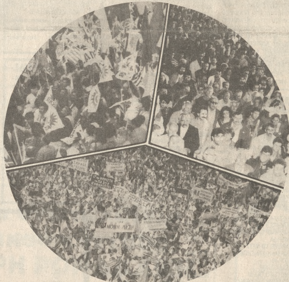
Χωρίς κεντρικές προεκλογικές συγκεντρώσεις στο Ηράκλειο, οι τρεις μεγάλοι πολιτικοί σχηματισμοί. Στις φωτο, απόψεις από τις συγκεντρώσεις των προηγούμενων εκλογών ΠΑΣΟΚ, Ν.Δ. και Συνασπισμού.

Ο Συνασπισμός της Αριστεράς και της Προόδου θα οργανώσει δημόσια συζήτηση του λαού του Ηρακλείου με το Γραμματέα της Κ.Ε. του ΚΚΕ και μέλος της Πολιτικής Επιτροπής των Αριστερών και Προοδευτικών