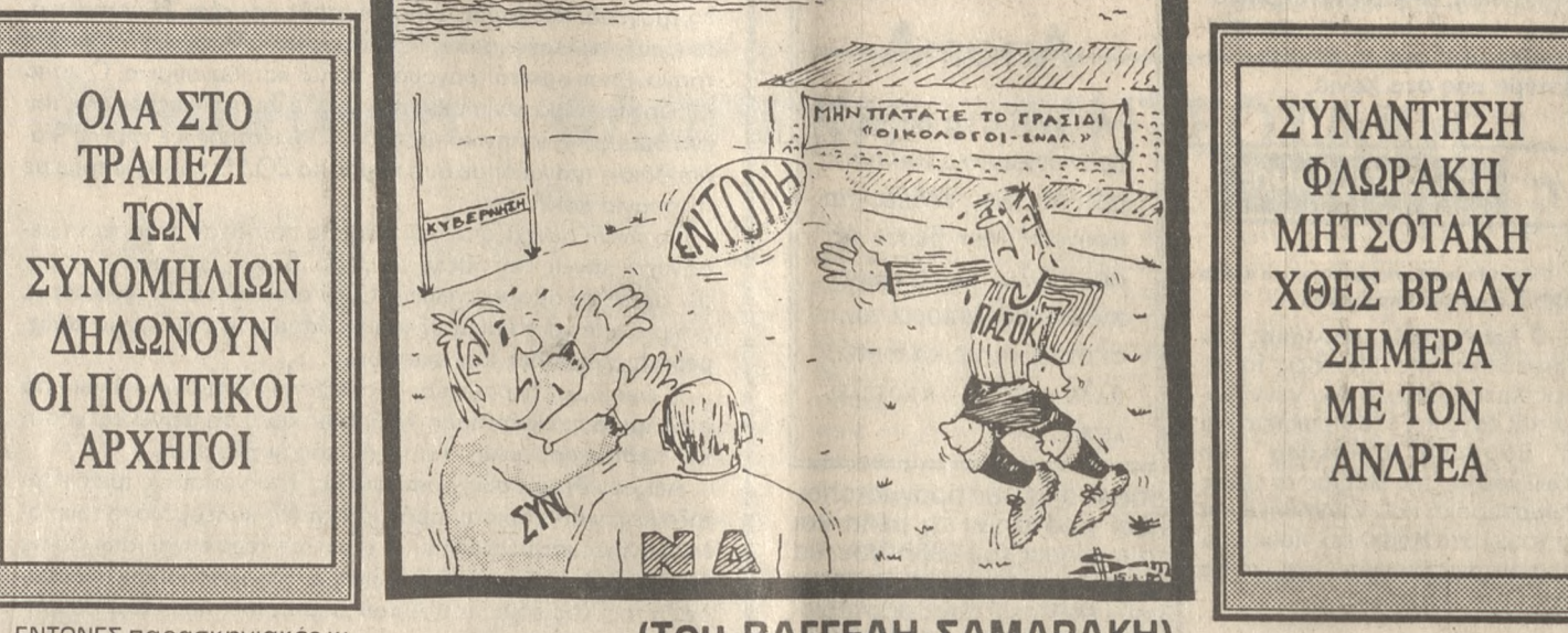
(ΤΟΥ ΒΑΓΓΕΛΗ ΣΑΜΑΡΑΚΗ)

ΟΛΑ ΣΤΟ ΤΡΑΠΕΖΙ ΤΩΝ ΣΥΝΟΜΗΛΙΩΝ ΔΗΛΩΝΟΥΝ ΟΙ ΠΟΛΙΤΙΚΟΙ ΑΡΧΗΓΟΙ