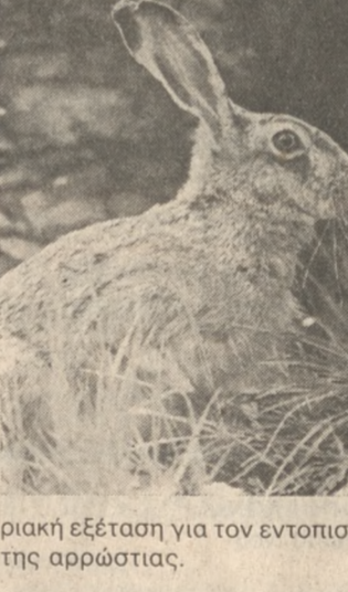
ριακή εξέταση για τον εντοπισμό της αρρώστιας.