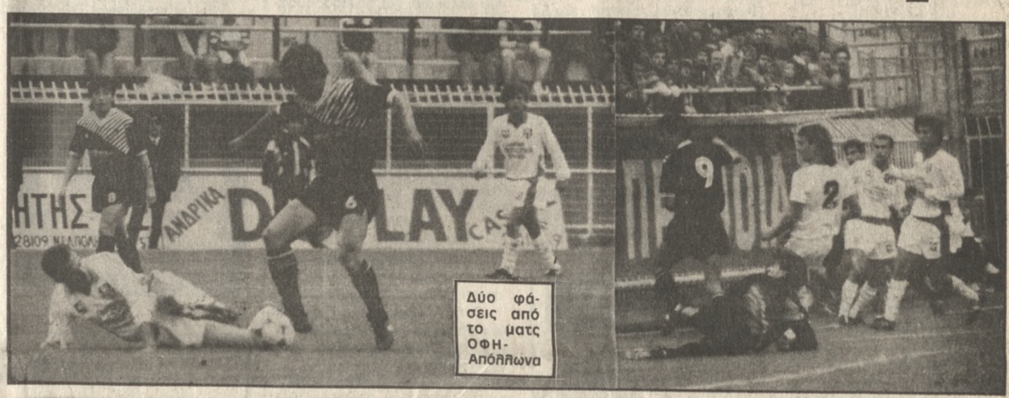
Δύο φάσεις από το ματς ΟΦΗ-Απόλλωνα

Με φανερά τα σημάδια του άγχους ο ΟΦΗ, στο γήπεδό του, ξεπέρασε το εμπόδιο του Απόλλωνα Αθ. (2-1) και βρίσκεται 2 βαθμούς πίσω από τους πρωτοπόρους. Οι παίκτες του ΟΦΗ είχαν άγχος, αφού μετά τις δύο συνεχείς ήττες ήθελαν οπωσδήποτε την νίκη.