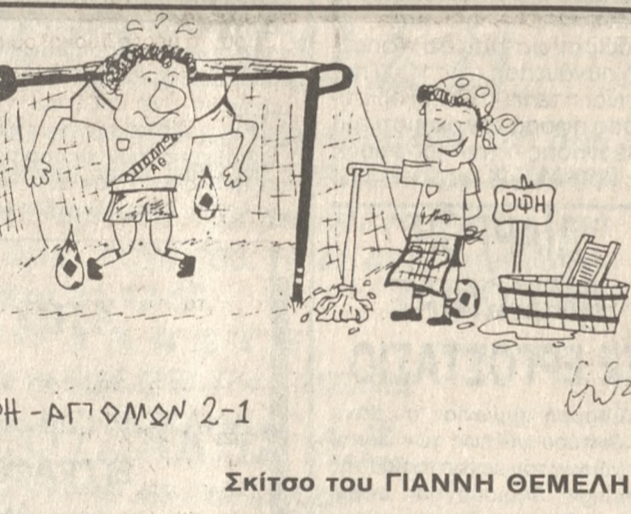
ΟΦΗ - ΑΠΟΛΛΩΝ 2-1