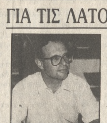
Συνάντηση του Νομάρχη Δημήτρη Κουενάκη και του Δημάρχου Κώστα Κληρονόμου πραγματοποιείται στις 10 σήμερα το πρωί. Στη σημερινή συνάντηση των εκπροσώπων της κυβέρνησης και της δημοτικής αρχής θα γίνει συζήτηση για το θέμα της εξεύρεσης νέων χώρων αναπόθεσης των απορριμμάτων της πόλης του Ηρακλείου και δημιουργίας λατομικών ζωνών.