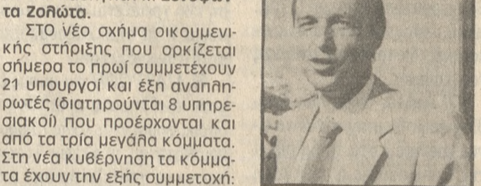
Επανερχεται στο γνώριμο από το παρελθόν υπουργείο Παιδείας ο καθηγητής κ. Κώστας Ζολώτας.