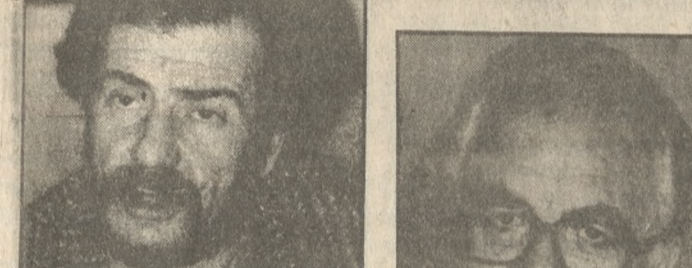
Εργάστηκε στην άτυπη Τριμελή Επιτροπή για τις προγραμματικές συγκλήσεις και από κει στο υπουργείο Εθνικής Οικονομίας