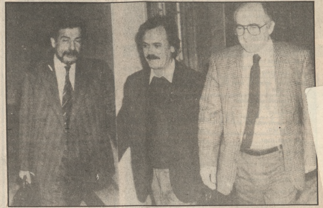
Στις συζητήσεις των υπουργών του Οικονομικού κύκλου τέθηκε η μεταρρύθμιση του φορολογικού συστήματος. Μάλιστα δεν εμφανίζεται, σε διεθνές επίπεδο, σε αρκετές περιπτώσεις. Οι άμεσοι φόροι αποτελούν μόνο το 28% της φορολογίας και οι έμμεσοι το 72%. Στόχος είναι να κλείσει κάπως αυτό το άνοιγμα και να υπάρξει μια, κατά το δυνατό, «ισορροπία». Άλλωστε αυτό το αίτημα έχει διατυπωήσει ήδη η μεγάλη πλειοψηφία των κοινωνικών φορέων σε εθνικό επίπεδο. Μάλιστα η «συγκατοίκηση» των τριών βασικών πολιτικών χώρων στην κυβέρνηση θεωρείται τώρα χρυσή ευκαιρία για την πρόωξη του αιτήματος. συνέχεια στη σελ. 3

Η διεύρυνση της φορολογικής βάσης αποτελεί φυσικά το κεντρικό σημείο της υπό συζήτηση μεταρρύθμισης. Θα πρέπει να σημειωθεί ότι αυτή τη στιγμή η «ψαλίδα» μεταξύ των άμεσων και των έμμεσων φόρων έχει ένα τεράστιο άνοιγμα, που