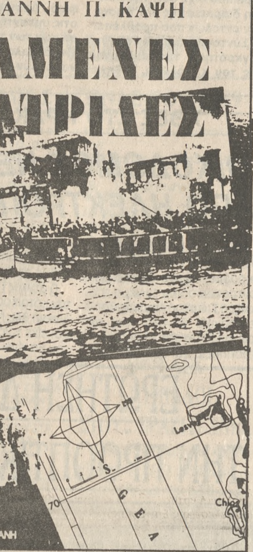
ΝΕΑ ΣΥΝΟΡΑ - Α.Α. ΛΙΒΑΝΗ

— Επιμέλεια έκδοσης: ΤΖΙΝΑ Α. ΛΙΜΠΟΥΤΑΚΗ. — Μακέτα εξωφύλλου: ΓΙΩΡΓΟΣ ΒΕΛΙΣΣΑΡΗΣ ΣΕΛΙΔΕΣ: 305, ΔΡΧ.: 1400