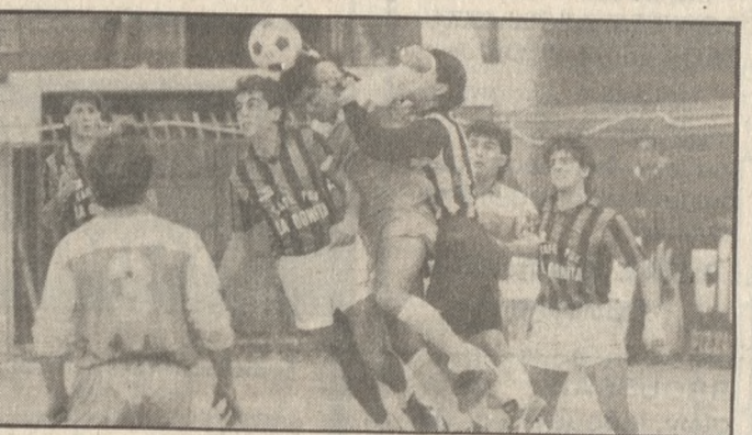
Φάση από τον αγώνα Μινωική-Ασήμι 2-3

Το Ασήμι εντός έδρας έχει 5 νίκες και 2 ήττες ενώ εκτός έχει 6 νίκες. Η Μινωική έχει εντός έδρας 4 νίκες 1 ισοπαλία και έχει ηττηθεί 2 φορές, ενώ εκτός έδρας έχει 6 νίκες. Εκτός όμως από αυτά τα στοιχεία ασ δούμε τι μας είχαν χθες οι δύο προπονητές των ομάδων: