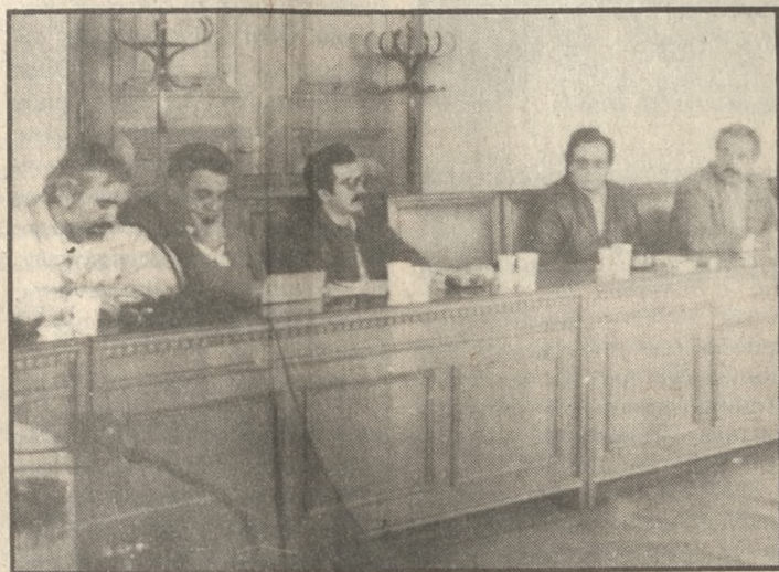
Από τη χθεσινή σύσκεψη του ΠΑΣΟΚ

Με το δεδομένο της εκρηκτικότητας του στεγαστικού προβλήματος στο Ν. Ηρακλείου πραγματοποιήθηκε χθες το πρωί, με πρωτοβουλία της Νομαρχιακής επιτροπής Ηρακλείου του ΠΑΣΟΚ σύσκεψη στην αίθουσα Ελευθερίου Βενιζέλου του Δήμου Ηρακλείου προκειμένου να υιοθετηθεί κοινή άποψη για το θέμα της σχολικής στέγης. Από τη ΝΕ του ΠΑΣΟΚ παρουσίασαν την εισήγηση οι κ.κ. Καρέλλης, Κουκιαδάκης, Καμπέλλης, Ο βουλευτής Μανώλης Παπαστεφανάκης, ο Περιφερειάρχης Κρήτης κ. Δημήτρης Μαλλιαράκης ο Νομάρχης Ηρακλείου κ. Δημήτρης Κουνενάκης εκπρόσωποι της Νομαρχίας, του Δήμου, του Συνασπισμού (Νιράκης), των Φιλελευθέρων (Τσαγκαράκης), και του συλλόγου δασκάλων και νηπιαγωγών Ν. Ηρακλείου οι οποίοι παραβρέθηκαν και συζητήσαν το πρόβλημα συμφώνησαν στην σύσταση επιτροπής παιδείας από φορείς σε συνεργασία με τους εκπαιδευτικούς των κομμάτων και των βουλευτών με πρώτο βήμα την άμεση πρόσκληση εκπαιδευτικών στην σύσκεψη, η επίσκεψη