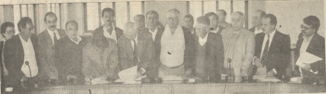
ΑΝΑΜΕΣΑ ΣΤΗ ΔΕΥΑΗ ΚΑΙ ΤΟΥΣ ΣΥΝΔΕΣΜΟΥΣ