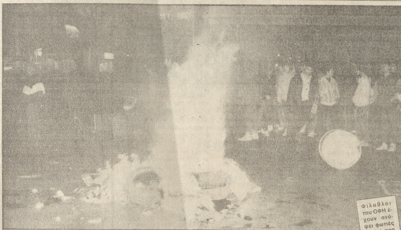
Φιλάθλοι του ΟΦΗ έχουν ανέψει φωτιές στο κέντρο της πόλης

Α ΛΛΗ μία χρονιά μπαίνει στο αρχείο της Ιστορίας καθώς επίσης και μία δεκαετία φεύγει. Και τί μένει πίσω της; Οι επιτυχίες, οι αποτυχίες, οι χαρές και οι λύπες κάθε ομάδας, κάθε αθλητή, κάθε παράγοντα, κάθε... Πρόσωπα που ξεχώρισαν, που κέρδισαν την αγάπη του κόσμου, που μονοψήφισαν την δημοσιότητα. Κάποιοι αθλητές που, για τις επιδόσεις τους θα μας μείνουν αξεχάστοι. Το αθλητικό τμήμα της «Πατρίδας» όλο αυτό το διάστημα προσπάθησε - και νομίζουμε ότι το κατάφερε - να μείνει όρθιο στις επάλξεις. Στόχος του ήταν να δώσει με αντικειμενικότητα στο αναγνωστικό Κοινό όλα τα αθλητικά γεγονότα κι εκείνο θα σχημάτιζε την δικιά του γνώμη. Ήταν μία προσπάθεια καθημερινή, πολύπλευρη, επίπονη, αγωνιώδης, αλλά και ωραία. Την προσπάθεια αυτή θα συνεχίσουμε και τα επόμενα χρόνια. Αυτό αποτελεί υπόσχεση. Την ώρα αυτή του απολογισμού και της ανασύνταξης, που δάζουμε τα νέα μέλη να δώσουν, μας, ως δούμη τα ξεχωριστά γεγονότα, πολύ περιληπτικά, που μας άφησε ο χρόνος που πέρασε.