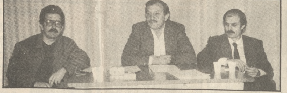
Οι εκπρ' οσάποιοι του ΚΚΕ στη χθεσινή συνέντευξη Τύπου

Από 1ης Ιουλίου τα κέντρα διακοδώνων, τα ανταλλακτικά αυτοκινήτων, τα εστιατόρια, ταβέρνες, μπαρ, καφέ μπαρ, σνακ μπαρ, καφετέριες, πισταρίες, χαρροπαλίστρες και γενικά καταστήματα που πουλάνε τρόφιμα και ποτά στις εξής περιοχές: