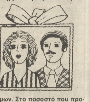
— Μόλις γηραιότεροι οι πατέρες, τηλεφώνω στο μάστορα!

• ΣΤΗΝ αρχή έγινε αρκετός θόρυβος. Σιγά - σιγά άρχισε να κοπάει. Τώρα έχει πέσει σε πολύ μικρά ποσοστά. Ο λόγος, για τον Πολιτικό Γάμο. Με τα στοιχεία που υπάρχουν Πολιτικό Γάμο κάνει το 1-3% αυτών που παντρεύονται, ανάλογα με την περιοχή και την προέλευση των