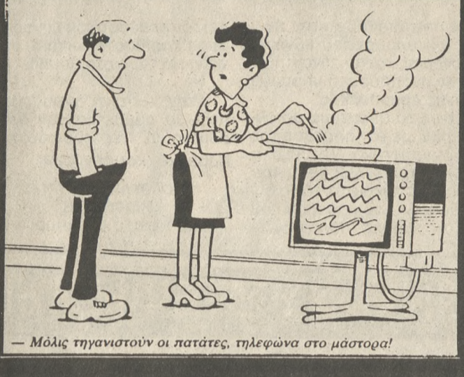
— Μόλις γηραιότεροι οι πατέρες, τηλεφώνω στο μάστορα!

ήταν αμφισβητούμενη, αλλά σήμερα είναι γενικά αποδεκτή.