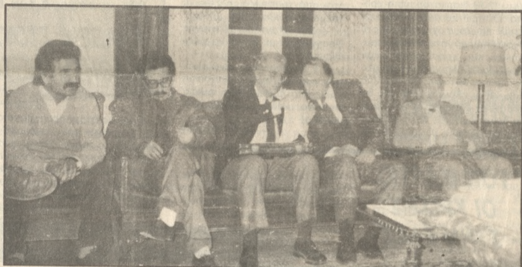
Τα μέλη της διακομματικής επιτροπής στη χθεσινή τους συνεδρίαση