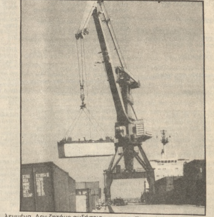
Λευμένα. Δεν ζητάμε αυξήσεις».

Παράλληλα-συνέχισε-δεν υπάρχει ηλεκτρολόγος με αποτέλεσμα να μην δουλεύει κανένα μηχανήματα. Δεν υπάρχει μηχανοτεχνίτης ή μηχανολόγος γιατί είναι όλοι επί συμβάσεως. Τα αιτήματα μας τα έχουμε κοινοποιήσει από 18-4-88 με εφώδικο στους αρμόδιους υπουργούς και ουδένια απάντηση πήραμε σ' αυτά. Συγκεκριμένα ζητάμε-χωρίς με αυτά να επιβαρύνουμε το προϋπολογισμό του κράτους-χρήματα δικά μας από υπερωρίες δεδου-