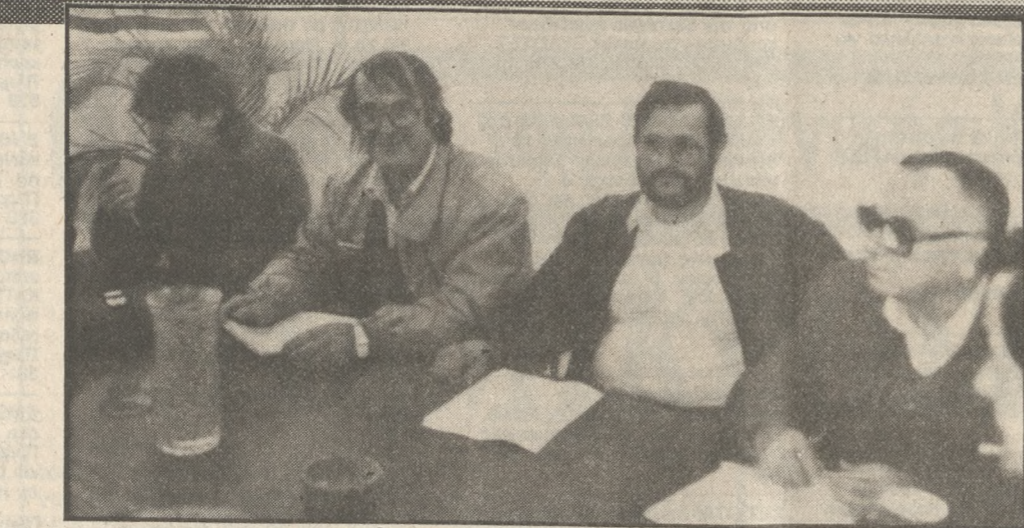
Οι εκπρόσωποι των αγροτών λάνι και την περιοχή της Έναςης Πεζών.

Αύριο Παρασκευή θα γίνουν συγκεντρώσεις στο Πενταμόδι, τον Πύργο, τα Αϊτάνια, το Σκα-