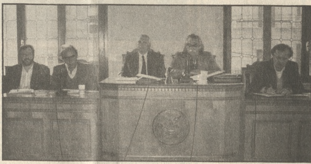
Νέα πρόκληση σε βάρος της Κρήτης καταγγέλλει ο Σύνδεσμος της ΤΕΔΚ. Στη φωτο στιγμιότυπο από τη χθεσινή συνεδρίαση.

Στην Κρήτη υπάρχουν σήμερα 13 αναπτυξιακοί σύνδεσμοι και ένας βρίσκεται υπό σύσταση στο νομό Ηρακλείου. Τα βασικά προβλήματα που σύμφωνα με