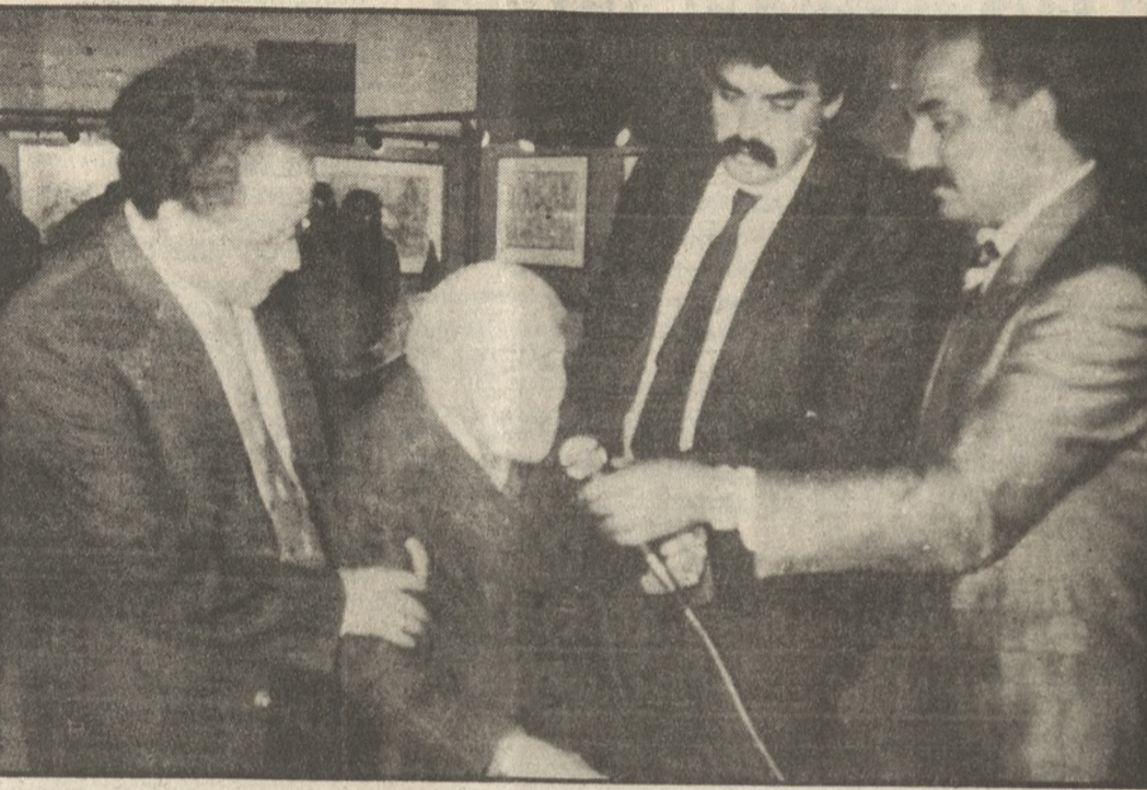
Η 95χρονη Μαρία Αμαργιώτου στη χθεσινή τιμητική εκδήλωση

Τιμήθηκαν χθες από τον Σύλλογο Δασκάλων Ν. Ηρακλείου, 24 δάσκαλοι οι οποίοι προσέφεραν ή προσφέρουν ακριβή, εκτός από τη διδασκαλία τους, ένα αξιόλογο συγγραφικό έργο. Η συγκίνηση στην εκδήλωση της απονομής η οποία έγινε στη Βασιλική Αγίου Μάρκου, κορυφώθηκε όταν πήρε το μικρόφωνο στα χέρια της η πρώτη γυναίκα σχολική σύμβουλος στην Ελλάδα, η 95χρονη σπύρα Μαρία Αμαργιώτου. Η κ. Αμαργιώτου η οποία σπούδασε στη Γερμανία έχει γράψει 4 βιβλία με βιογραφικά θέματα της Κρήτης. Τα τιμητικά διπλώματα στους βραβευμένους εκπαιδευτικούς τα οποία συνοδεύτηκαν με ένα σύντομο βιογραφικό για τον καθένα, απένειμαν τα μέλη του Διοικητικού Συμβουλίου του Συλλόγου Δασκάλων Ηρακλείου.