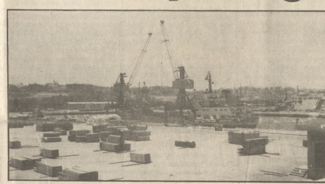
ΣΠΑ αποτελεί ουσιαστικά και την πρώτη σοβαρή προσπάθεια αντιμετώπισης σημαντικών τομέων δραστηριότητας του νησιού, στα πλαίσια του υγιεινού προγράμματος.

Ο κ. Δραγασάκης, που ζήτησε ήδη ενημέρωση για τα προβλήματα αιχμής του νομού αλλά και της Κρήτης συνολικά, στοχεύει στην επιτό-