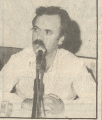
Ότι σε κάθε περίπτωση η μισθοδοσία των εργαζομένων στις προβληματικές επιχειρήσεις, δεν μπορεί να τίθεται κάθε μήνα υπό αμφισβήτηση».