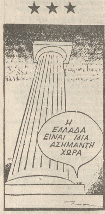
Η ΕΛΛΑΔΑ ΕΙΝΑΙ ΜΙΑ ΑΣΗΜΑΝΤΗ ΧΩΡΑ

Άγνωστοι εξάλλου έκλεμαν 3 αίκες και 3 ρίφια αξίας 100.000 δρχ. περίπου από απεριφράκτο χώρο του Μιχάλη Παπαδάκη στα Σταυράκια.