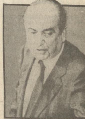
ρήσει επιστρέφοντας στην Αθήνα.

Οι εργασίες της συνδιάσκεψης στην οποία θα πάρουν μέρος και οι βουλευτές του κόμματος απ' όλη την Κρήτη θα ολοκληρωθεί αργά το απόγευμα οπότε και ο πρόεδρος της Ν.Δ. θα αναχω-