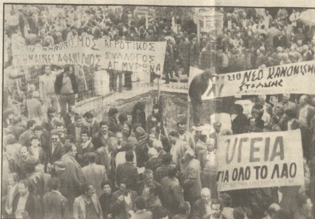
Κε χθες όχι μόνο από τα μέσα μαζικής ενημέρωσης αλλά και από την κοινή γνώμη του Ηρακλείου, που στέκεται πλάι στον αγώνα των παραγωγών.

Θα πρέπει πάντως να τονιστεί ιδιαίτερα το μέγεθος αλλά και ο ειρηνικός και ενωτικός χαρακτήρας του συλλαλητηρίου. Παρά τον όγκο και την αγωνιστική διάθεση των διαδηλωτών δεν δημιουργήθηκε το παραμικρό πρόβλημα με αποτέλεσμα, παρά την οξύτητα του προβλήματος και την απόλυτα δικαιολογημένη αγανάκτηση των αγροτών, δεν δημιουργήθηκε το παραμικρό πρόβλημα και η παρουσία των αστυνομικών δυνάμεων ήταν μάλλον διακοσμητικά. Αυτή η στάση επισημάνθη.