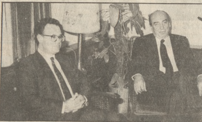
Ο πρόεδρος της Ν.Δ. κ. Μητσότακης με τον Νομάρχη Ηρακλείου

Τα προβλήματα που απασχολούν τις παραγωγικές τάξεις τους κοινωνικούς φορείς και όλο το λαό του Ηρακλείου και τα οποία απαιτούν άμεσες λύσεις έθεσε ο Νομάρχης Ηρακλείου κ. Κουνενός στον πρόεδρο της Ν.Δ. κ. Μητσότακη με τον οποίο συναντήθηκε το Σάββατο το απόγευμα στη Νομαρχία. Ο κ. Κουνενός τόνισε στον πρόεδρο της Ν.Δ. ότι προβλήματα «αιχμής» είναι αυτά της υγείας, παιδείας, υποδομών τα αγροτικά και μια σειρά άλλων για τα οποία, όπως είπε, έχουν γίνει προσπάθειες σε τόπο επίπεδο να δρομολογηθούν λύσεις αλλά απαιτείται και η βοήθεια από την πολιτική ηγεσία του τόπου.