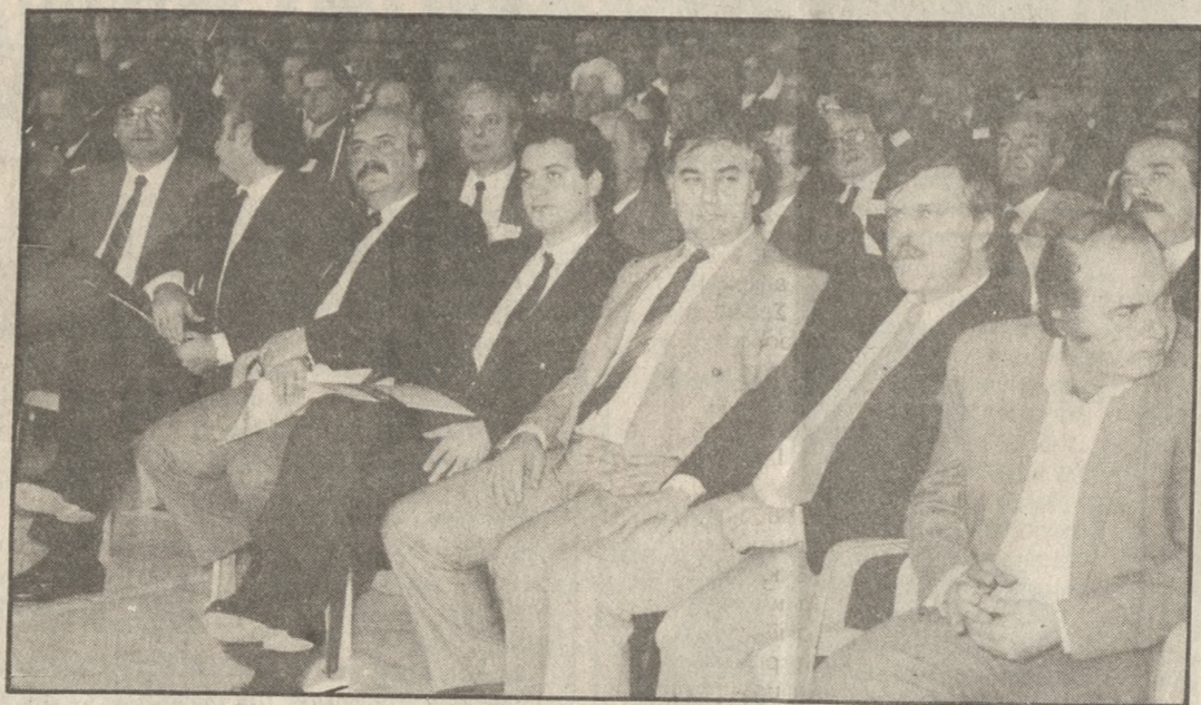
Από τις εργασίες της Συνδιάσκεψης της Νέας Δημοκρατίας

δεν θα δεχθεί καμιά φορολογική επιβάρυνση αν προηγουμένως δεν υπάρξουν φορολογικές ελαφρύνσεις. Χωρίς σημαντική περικοπή δαπανών είπε ο κ. Μητσότακης δεν θα δεχθούμε άλλες επιβαρύνσεις. Στο σημείο αυτό ο κ. Μητσό-