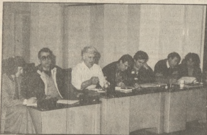
Συνδικαλιστές του Επισιτισμού στη χθεσινή συνέντευξη Τύπου