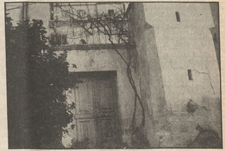
Το κτίριο που στεγάστηκε κάποτε η Μητρόπολη στη Βιάννο

ΒΙΑΝΝΟΣ (Του ανταποκριτή μας Μανόλη Σπανάκη)