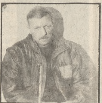
μου Τρικάλων. ΑΝΕΧΟΡΗΣΑΝ ΟΙ ΓΕΡΜΑΝΟΙ ΜΕ ΤΙΣ καλύτερες εντυπώσεις

σταμάτης. ΑΝΑΦΕΡΟΜΕΝΟΣ στον αγώνα με τον Λεβαδειάκο ο προπονητής του ΟΦΗ Κ. Γκέραρντ είπε τα εξής: «Στο ματς της Κυριακής πρέπει, δυστυχώς, να παίξουμε με