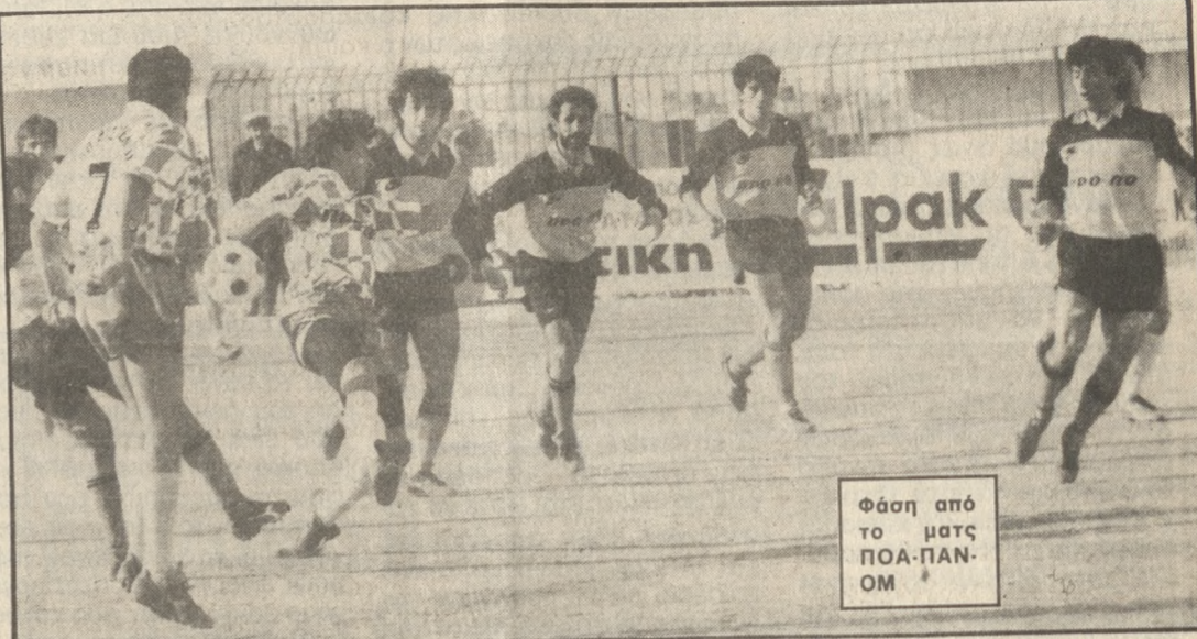
Φάση από το ματς ΠΟΑ-ΠΑΝΟΜ