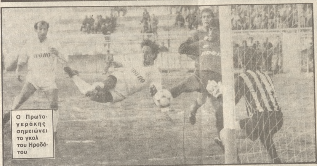
Ο Πρωτογενεράκης σηκώνει το γκολ του Ηρόδοτου