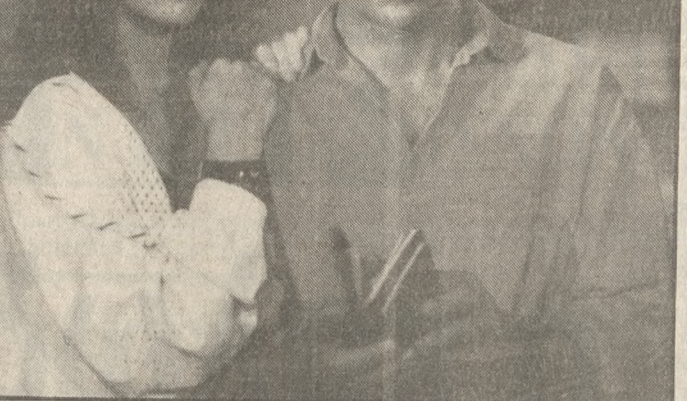
Η Νικόλ Κληντανό και ο Σαμ Νηλ στο συσταραλέικο θρίλερ «Κρουαζιέρα στην άκρη του τρύφου».

Η ιστορία είναι απλή, τόσο που μόλις και αποτελεί πρόφαση: «Ε