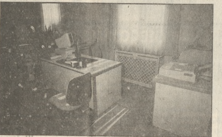
Ο χώρος στον οποίο στεγάζεται η «ερωθυρίδα».