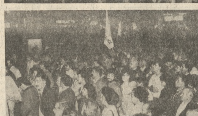
Ναι στο διάλογο από Τ.Υ., ραδιόφωνο και εφημερίδες λένε οι Ηρακλειώτες

Ο κ. Γιώργος Φυγετάκης μας είπε: «Οι εκλογικές αναμετρήσεις, έχουν γίνει πια για τους Έλληνοσ υποθέσεις ρουτίνας. Εγώ προσοικώ και το λέω απερίφραστα, βαρβήκα. Μ' έχει κουράσει ο φανατισμός και τα μεγάλα λόγια. Πριν κάποια χρόνια συμμετείχα σε παρόμοιες εκστρατείες. Όμως είμαι σίγουρος τώρα πια