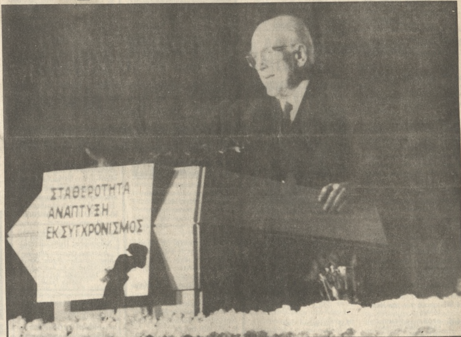
Τη βεβαιότητά του για τη νίκη του ΠΑΣΟΚ στις εκλογές του Απριλίου εξέφρασε χθες βράδυ στην πλατεία Ελευθερίας ο Ανδρέας Παπανδρέου

Αυτή η ανανεωτική και εκσυγχρονιστική κυβέρνηση θα είναι ικανή να συσπειρώσει και να εμπνεύσει όλες τις δημοκρατικές δυνάμεις του τόπου.