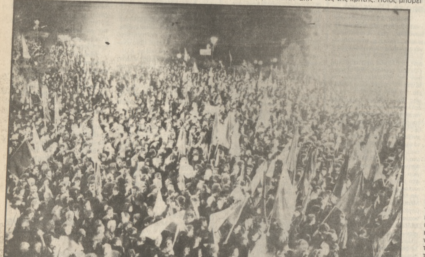
Χιλιάδες λαοί κατέκλυσαν χτες το δρόμο την πλατεία Ελευθερίας στην πρώτη μεγάλη συγκέντρωση του ΠΑΣΟΚ στην τελική προεκλογική εξόρμηση

Μπορεί και πρέπει ο Ιδιωτικός Τομέας να γίνει ανταγωνιστικότερος και ο Δημοσίου Τομέας πιο δημιουργικός, πιο παραγωγικός και πιο ευέλικτος, χωρίς αγκυλώσεις, παρωπίδες και