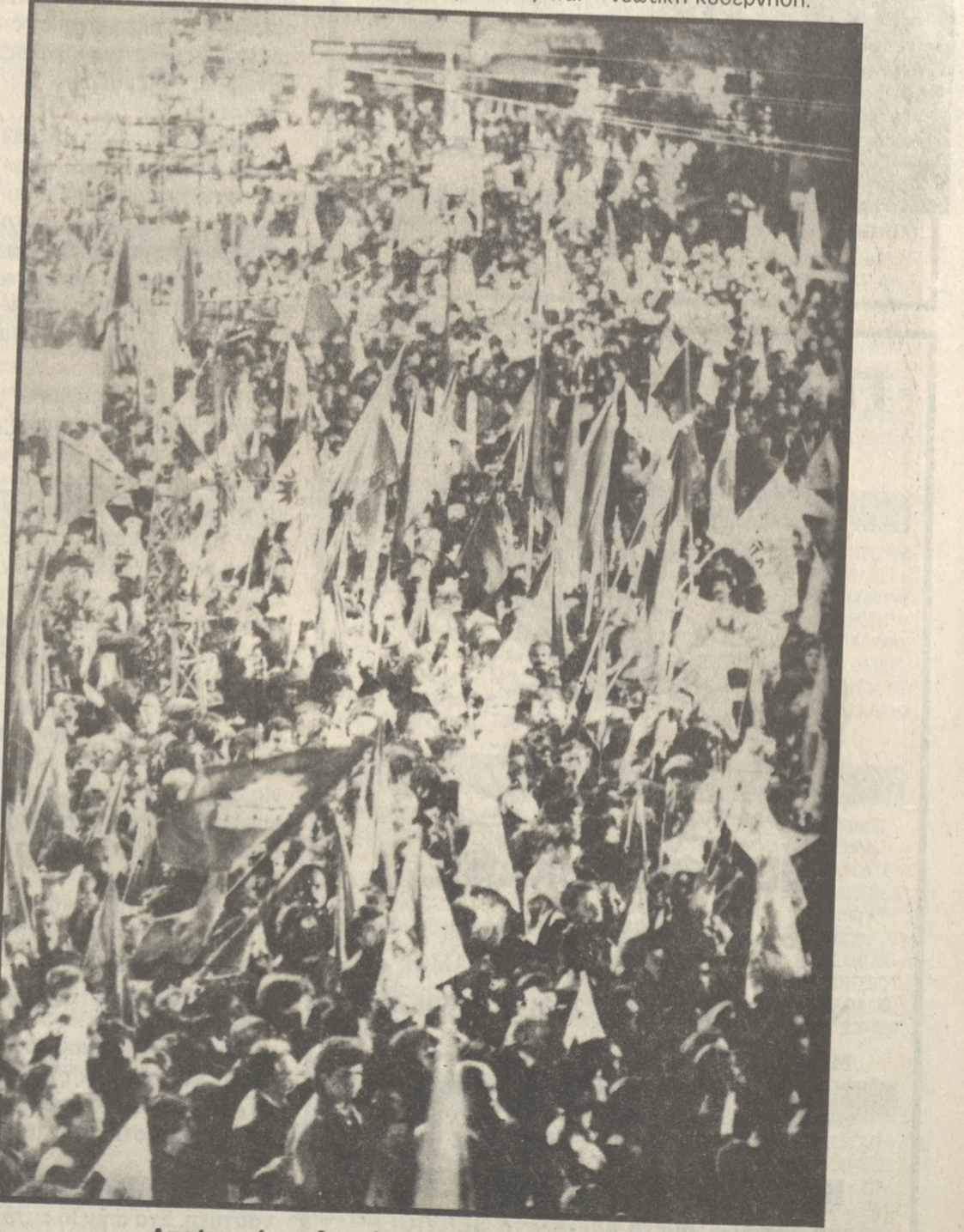
Αποψη από τη χθεσινή μεγάλη συγκέντρωση.