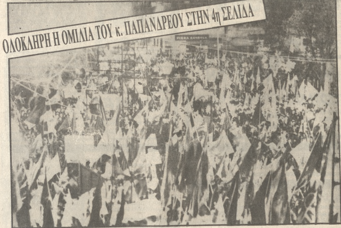
ΟΛΟΚΛΗΡΗ Η ΟΜΙΛΙΑ ΤΟΥ κ. ΠΑΠΑΝΔΡΕΟΥ ΣΤΗΝ 4η ΣΕΛΙΔΑ

Και είπε ότι κυριαρχεί πια η αντίληψη, η βεβαιότητα για αυτή την εξέλιξη. Από τα στοιχεία αυτά, είπε, διαφαίνεται ότι στις 9 Απριλίου η κυβέρνηση που θα έχει ο τόπος θα είναι ισχυρή και ικανή, θα έχει πρόγραμμα με διάρκεια και προοπτική.