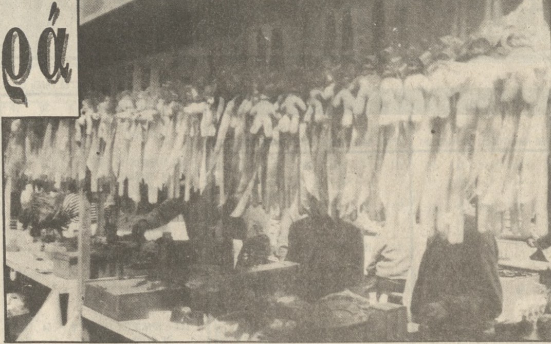
Μικρή κίνηση στις λαμπάδες παρά την Μεγάλη Εβδομάδα

κιλό έναντι 700 δρχ. που επωλήθησαν πέρυσι, ενώ η πασαλοκουλούρα 750 δρχ. το κιλό πέρυσι. Πέρυσι η κουλούρα του Πάσχα стоίχιζε 560 δρχ. Η τιμή του αυγού έμεινε σταθε-