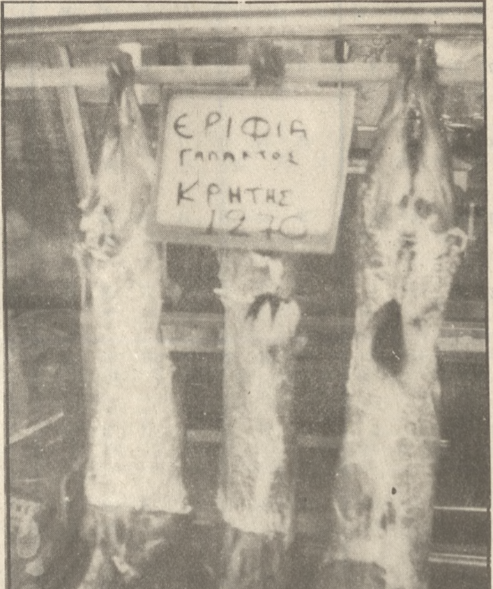
Στις 1.270 «πέταξε» η τιμή των εριφίων γάλακτος 850-900 δρχ. το κιλό. Τα τσουρέκια 1000 δρχ. το κιλό, δηλ 18-20 δρχ. το ένα, ενώ η τιμή της μυζήθρας αυξήθηκε

Οι τιμές των ζυμαρικών, όπως καλιτσούνια, τσουρέκια, πασαλοκουλούρες, είναι εξ-