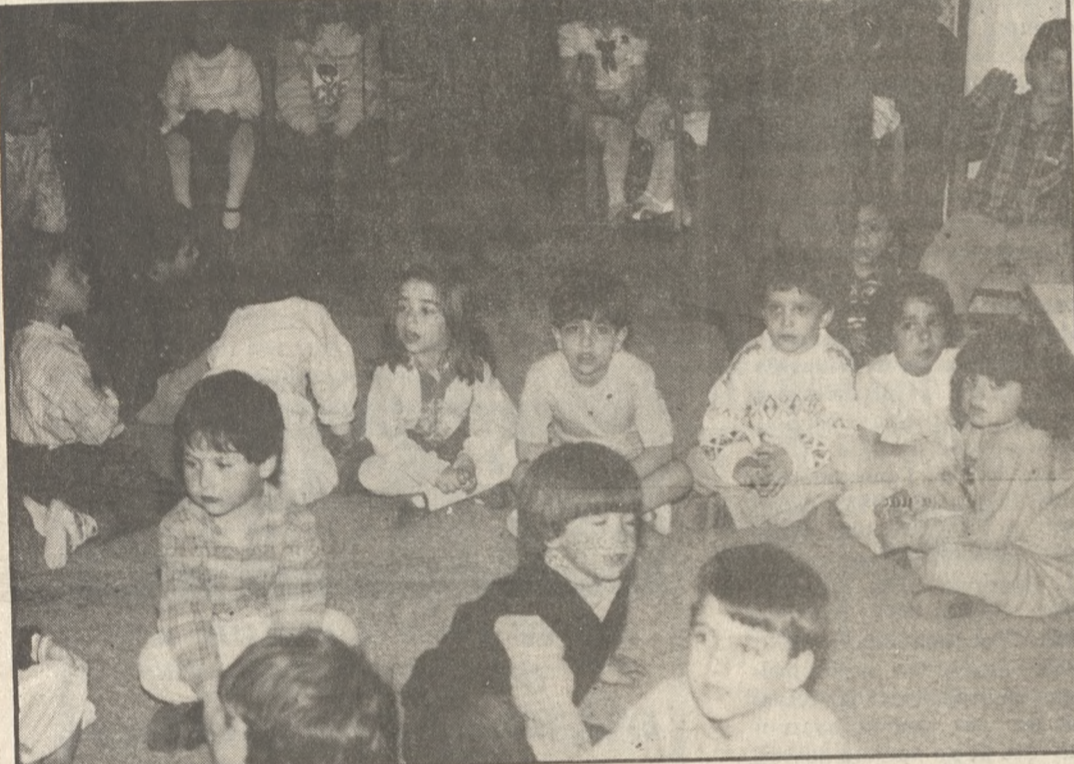
Μια όμορφη οικογενειακή εκδήλωση έγινε στον 2' Κρατικό Παιδικό Σταθμό Ηρακλείου. Στην