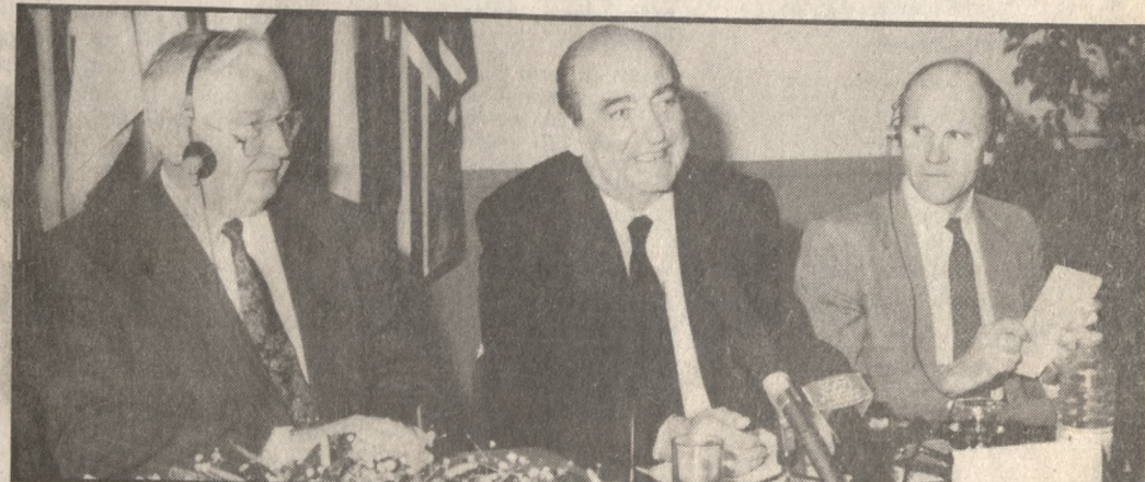
Ο Πρωθυπουργός κ. Μητσοτάκης στο συνέδριο των Ευρωπαϊκών Λαϊκών στη Χερσόνησο

«Η νέα Ελληνική κυβέρνηση είναι αποφασισμένη να ενε-