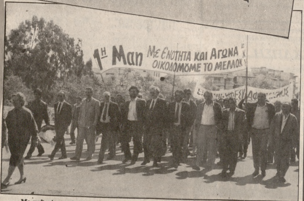
Με μαζική συγκέντρωση και πορεία οι εργαζόμενοι του Ηρακλείου γιόρτασαν την εργατική Πρωτομαγιά επιφέροντας την αντίθεσή τους στα οικονομικά μέτρα.