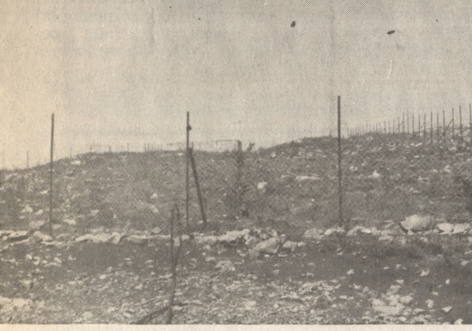
Η Ντία χωρισμένη με συρματοπλέγματα σε δύο τμήματα

καταστρέφουν τη κληρίδα της Ντίας, τη φύτευση νέων δέντρων και την καταγραφή φυτών και ζώων, εφαρμόζεται εφέτος για δεύτερη συνεχόμενη χρονιά από τη Διεύθυνση Δασών. Όπως μας είπε χθες ο δασολόγος της Διεύθυνσης κ. Μιχά-