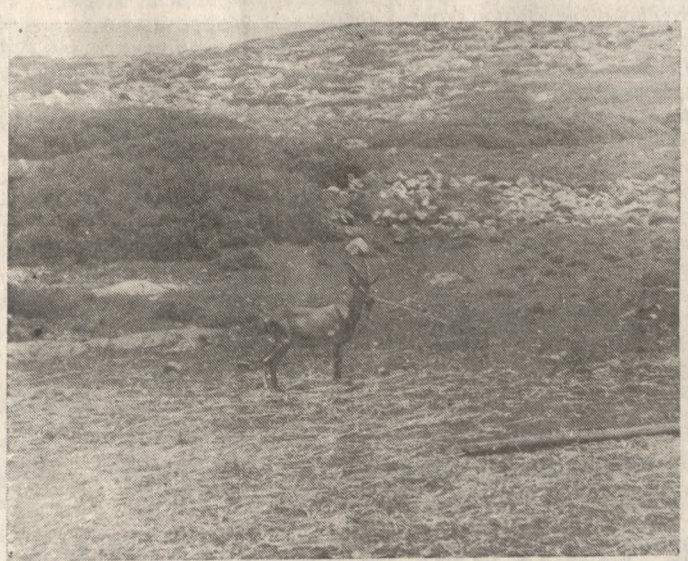
Στη φωτο ένας καθαρόαιμος αίγαγρος. Οι μιγάδες πρόκειται σύντομα να αντικατασταθούν με γνήσια κρι-κρι.

ηλις Οικονομίας, η πρώτη φάση του σχεδίου ολοκληρώθηκε το 1989-οι εργασίες αναμένεται να περατωθούν σε 6 περίπου χρόνια- με τον διαχωρισμό της έκτασης, με συρματοπλέγματα σε δύο τμήματα προκειμένου να ελεγχεται το κυνήγι, το οποίο θα γίνεται στη