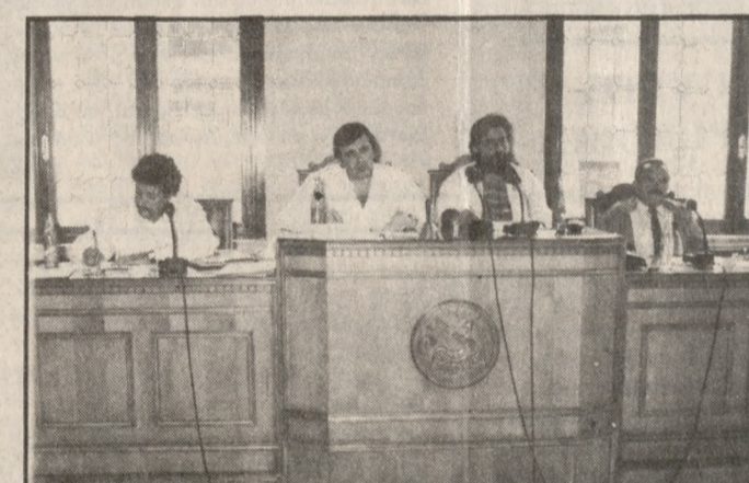
Από τη χθεσινή σύσκεψη των δημοτικών υπαλλήλων που έγινε στο Δήμο Ηρακλείου.

Παρόληθα μετά από αίτημα των εκπαιδευτικών των διοικήσεων των συλλόγων αποφασίστηκε η σύσταση ενός άτυπου περιφερειακού οργάνου αποτελούμενο από μέλη των Δ.Σ. το οποίο και θα συνέρχεται σε τακτά χρονικά διαστήματα για να συζητάει τα προβλήματα που αντιμετωπίζουν οι Δήμοι και να μεταφέρει προτάσεις για επίλυση τους στην Ομοσπονδία.