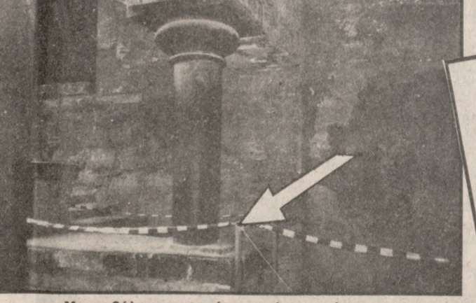
Με το βέλος το σημείο ρωγμής του κίονα.

Η κνωσός καταρρέει! Ένας από τους κίονες του μεγάλου κλιμακοστασίου παρουσίασε σοβαρό πρόβλημα φθοράς στη βάση του με αποτέλεσμα, προκειμένου να μην προκληθεί στύλκνη, η ειδική επιτροπή για τη συντήρηση του ανακτόρου της ΚΓ Εφορίας ΚΗσαιοτών και Προϊστορικών Αρχαιοτήτων να κάνει μια πρόχειρη προσωρινή αντιστήριξη με ξύλο και να κλείσει το χώρο ώστε να μην είναι δυνατή η πρόσβαση των επισκεπτών.