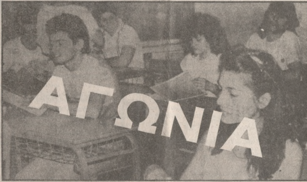
Ελπίδες για διέξοδο και διεξαγωγή των εξετάσεων

Υπενθυμίζεται ότι τετράωρες στάσεις εργασίας έχει προτείνει και η Πανελλήνια Ομοσπονδία Σιλλήλων υπουργείου Παιδείας (ΠΟΣΥΠ) στους σιλλήλους-μέλη για 7, 8, 11, 12 και 13 Ιουνίου, καθώς και 24ωρες επαναλαμβανόμενες κατά τις ημέρες διεξαγωγής των γενικών εξετάσεων που αρχίζουν στις 14 Ιουνίου.