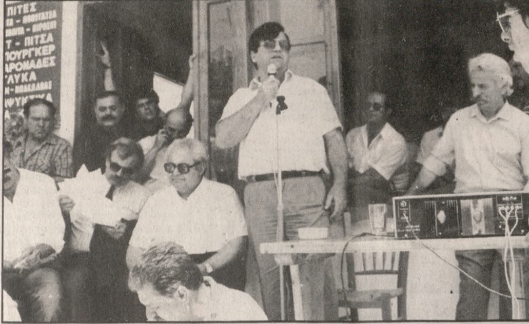
Ο Γενικός Γραμματέας του Υπουργείου Εμπορίου κ. Δημ. Μαλλιαράκης διαβεβαιώνει τους μπανανοπαραγωγούς για την απόφαση της Κυβέρνησης να προστατεύσει το εισόδημά τους.

Στη Γ.Σ. των καλλιεργητών μπανάνων παραυβέθησαν οι βουλευτές Ηρακλείου της Ν.Δ. κ. Μανώλης Κεφαλογιάννης, του ΠΑΣΟΚ κ.κ. Δημήτρης Σαρής, Κώστας Μπαντουβάς και Φοίβος Ιωαννίδης (Ιασιθίου) ενώ τα κόμματα εκπροσώπη-