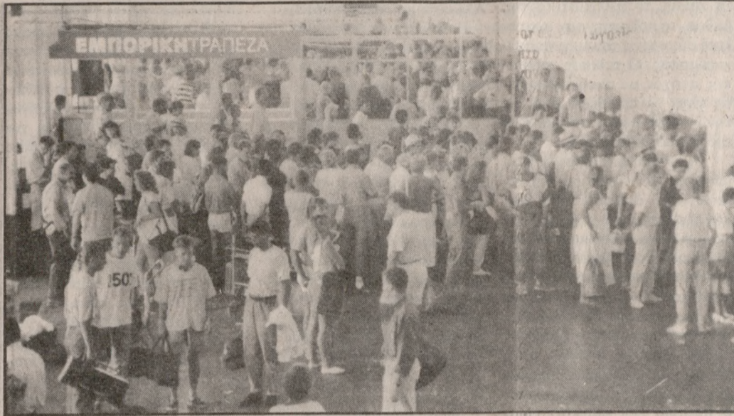
Χωρίς γιατρό οι διακινούμενοι από το αεροδρόμιο

επιλογή των κατασκευαστών ενώ σύντομα πρόκειται να γίνει και η δημοπράτηση του έργου επέκτασης. Όπως είναι γνωστό ο αρχικός προϋπολογισμός για την κατασκευή του είναι 4 δις 300 εκατ. δρχ. Μιλώντας ο Αερολιμενάρχης για τον ανύπαρκτο Υγειονομικό Σταθμό στο Αεροδρόμιο, τόνισε ότι «δεν νοείται ένα αεροδρόμιο σαν αυτό του Ηρακλείου, να μην έχει γιατρό, την στιγμή που φιλοξενεί καθημερινά 10-12 χιλιάδες κόσμο».