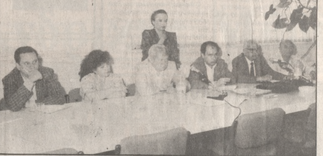
Κατηγορηματικοί στη χθεσινή σύσκεψη οι εκπρόσωποι της ΕΟΚ

Είναι γνωστό ότι ο επιχειρηματικός κόσμος επί χρόνια επέμενε και επέτυχε την αποικιοποίηση της προσωπικότητας και η Κυβέρνηση Τζαννιτάκη, την θεσμοθέτησε, γεγονός που χαιρετίσθηκε σαν ένα βήμα πρόοδο στις σχέσεις Κράτους-Πολίτη». Και το τηλεγράφημα καταλήγει ζητώντας την επανεξέταση του θέματος από την κυβέρνηση.