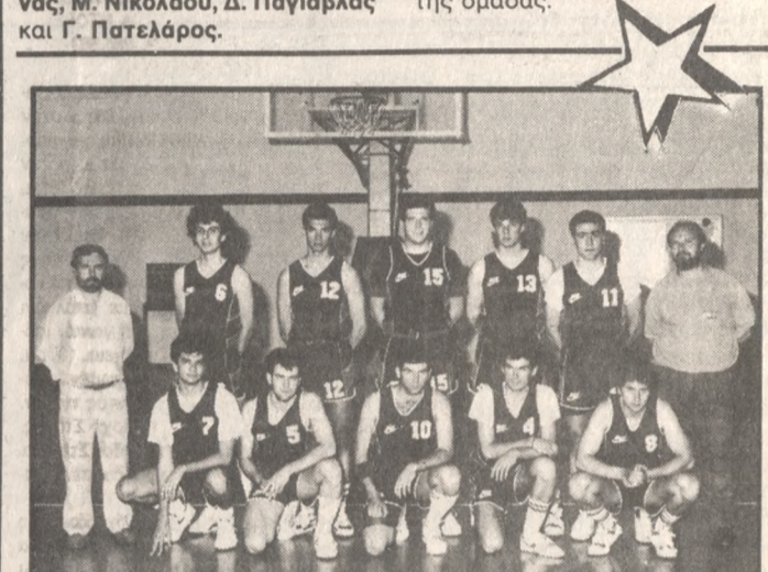
Η ομάδα μπάσκετ του Πανεπιστημίου Κρήτης που πήρε την 4η θέση στους Πανελλήνιους αγώνες.