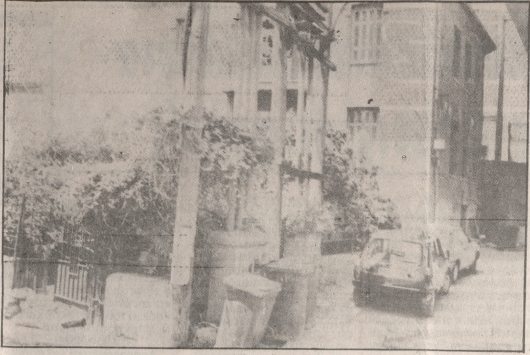
Άποψη από το εξωτερικό μέρος της "Πολυκλινικής"

νή κατάρευση του κτιρίου. Υπάρχει μια καταγγελία των γειτόνων με πολλές υπογραφές προς τις αρμόδιες υπηρεσίες που ορισμένες ανταποκρίθηκαν θετικά με πρώτη την υγειονομική πλειερά, αλλά, η απάντηση μένει στα χαρτιά χωρίς έργο. Ελπίζουμε ότι με τη δημοσίευσή μας αυτό θα επισπεύσουν οι αρμόδιες υπηρεσίες και μάλιστα πρώτες οι Δημοτικές να απαλλάξουν μια ολόκληρη περιοχή από όλα όσα προαναφέραμε και να μην αναγκαστούν οι κάτοικοι που υποφέρουν από τα προβλήματα να επικαλεστούν το Νόμο για την επίλυση τους».