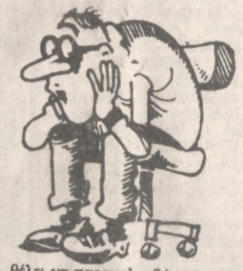
Θέλει να παρακολουθήσει την ενημέρωση.

Ενημερωτική σύσκεψη για τα προβλήματα που έχει δημιουργήσει η εφαρμογή του νέου φορολογικού νόμου 1882/90 στο χώρο των επαγγελματιών που ασχολούνται με την οικοδομή, οργανώνει την Τρίτη στις 8 το βράδυ το Επιμελητήριο Ηρακλείου. Η σύσκεψη θα γίνει στην αίθουσα του Επιμελητηρίου στην οδό Κοραναίου και θα γίνει ενημέρωση των μελών των επαγγελματιών Σωματείων για τις διατάξεις του νόμου. Θα συμμετάσχουν τα Διοικητικά Συμβούλια των Σωματείων αλλά και όποιο μέλος