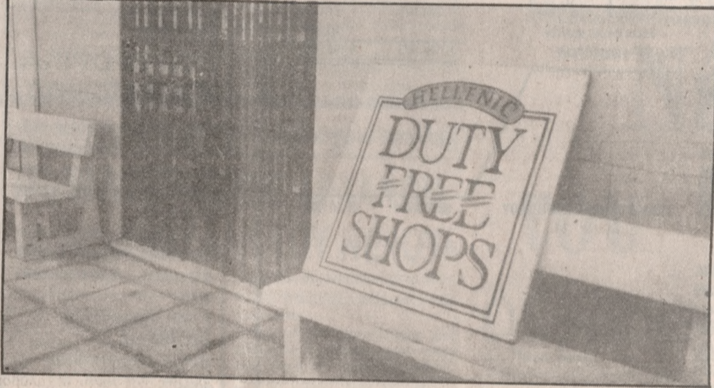
Το Duty Free του λιμανιού σφραγισμένο τις μισές μέρες της εβδομάδας

Δεκάδες εκατομμύρια κινδυνεύει να χάσει φέτος το κατάστημα αφορολογητών ειδών του λιμανιού αφού σύμφωνα με απόφαση του υπουργείου Οικονομικών, η οποία κοινοποιήθηκε πριν από 1 περίπου μήνα δεν επιτρέπεται η αγορά ειδών, από το κατάστημα, τόσο στους επιβάτες, όσο και στα πληρώματα των κρουαζιερόπλοιων που καταπλέουν στο λιμάνι από το εξωτερικό και αποπλέουν με προορισμό άλλα ελληνικά λιμάνια. Εκείνο όμως που δεν αναφέρεται στην ανακοίνωση του υπουργείου είναι ότι οι επιβάτες μιας και δεν αγοράζουν από το Duty Free του λιμανιού αφήνουν το συνάλλαγμα στα αφορολόγητα καταστήματα των πλοίων που ανοίγουν μόλις αποπλεύσουν και στα Duty Free άλλων λιμανιών όπως εκείνα του Ισραήλ, της Τουρκίας, της Κύπρου ή της Αιγύπτου.