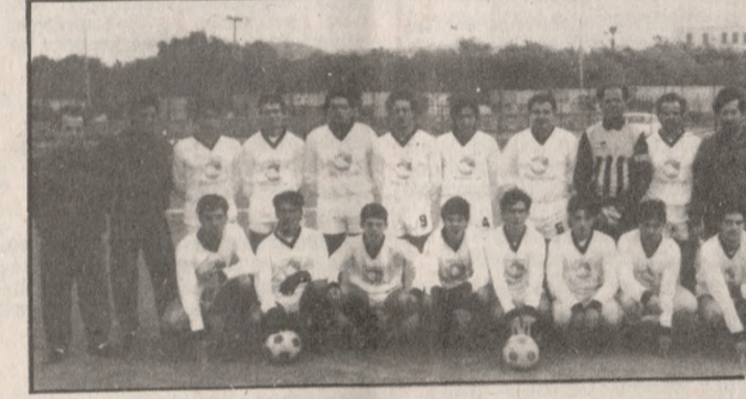
Η ομάδα της Δόξας Ηρακλείου η οποία κατά την νέα περίοδο θα αγωνίζεται στο τοπικό πρωτάθλημα Α' Κατηγορίας.

Η Δόξα Ηρακλείου νίκησε στο ντέρμπι κορυφής την ΑΕΛΠ με 3-2 και κατέκτησε αήττητη το Πρωτάθλημα του β' Ομίλου της Β' Τοπικής Κατηγορίας. Άξια πρωταθλήτρια η ομάδα του Ηρακλείου και του χρόνου θα αγωνίζεται στην Α' τοπική.