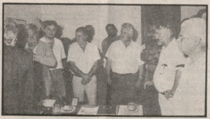
Αγανακτισμένοι οι εκπρόσωποι του ΤΟΕΒ Φοινικιάς στο γραφείο του Περιφερειάρχη.