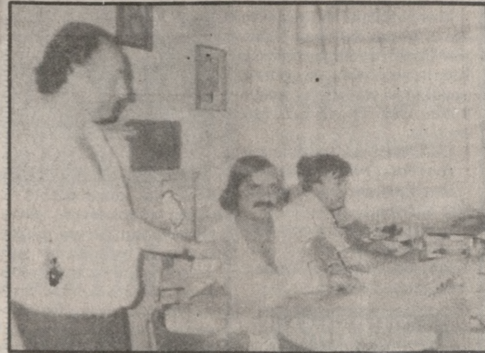
Στιγμιότυπο από τη χθεσινή ψηφοφορία στο ΕΚΗ

Η «αγωνιστική συμπάραταξη» (ΣΥΝ) με επικεφαλής τον