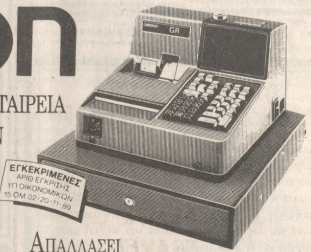
ΕΓΚΕΚΡΙΜΕΝΕΣ ΑΠΟ ΕΚΡΠΗΓΗ ΥΠΟ ΟΙΚΟΝΟΜΙΚΩΝ 15 ΟΜ 02/20-11-89

Η ΠΡΩΤΗ ΚΑΙ ΜΕΓΑΛΥΤΕΡΗ ΕΤΑΙΡΕΙΑ ΝΟΜΙΜΩΝ ΚΑΙ ΕΓΚΕΚΡΙΜΕΝΩΝ ΦΟΡΟΛΟΓΙΚΩΝ ΤΑΜΕΙΑΚΩΝ ΜΗΧΑΝΩΝ ΣΤΗΝ ΕΛΛΑΔΑ