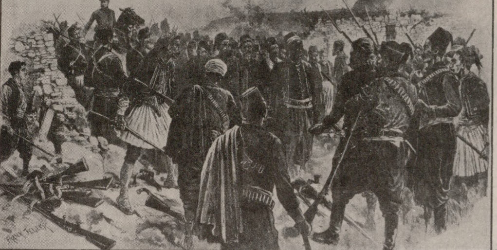
Φωτογραφία ντοκουμέντο. Αιχμάλωτοι Τούρκοι από Κρήτες επαναστάτες το 1897.

ένα πρωτότυπο τρόπο την μακραινών και πολυτάπη ιστορία του νησιού μας. Το υλικό αυτό, μας πληροφορήσει ο κ. Παναγιωτάκης, προέρχεται από ιδιωτικές συλλογές και μουσεία του εξωτερικού κυρίως, αλλά και της Ελλάδας. «Σ' αυτό έγκειται, είπα, η