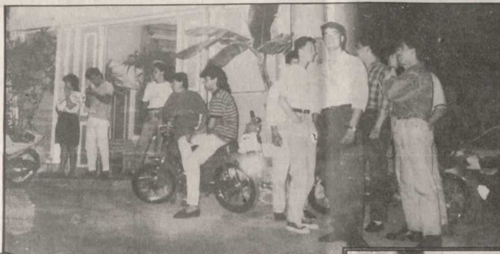
Ωρα για ραντεβού έξω από το μπαρ (πάνω) Πόσο μακρινό παρελθόν είναι η εποχή της οπερέτας... (δεξιά) Με μπύρα στο μπαρ και έξω τα ντέρτα γι' απ νεολαία (κάτω)

Ο παλιός τρόπος διασκέδασης των νέων, έχει περάσει α-νεπιστρεπτά. Ο νέος τρόπος διασκέδασης είναι πράγματι γέννημα-θρέμμα της σύγχρονης εποχής. Η «Π» το ήμουν να κάνει έρευνα, γι' αυτόν ακριβώς τον τρόπο διασκέδασης που «σπέρνει βροχές και... θερώνει θύελλες».