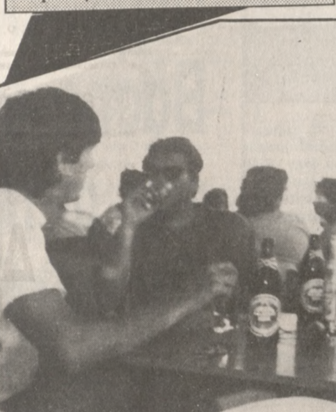
«δυνατό αμάξι. Για να συντηρήσω το αμάξι μου, μου φεύγουν τόσα λεφτά, όσα θα χρειαζόταν για να ζήσω τέσσερις γυναίκες. Ξέρεις κάτι; Το

σκο στο Ηράκλειο ή στη Χερσόνησο. Κάπου-κάπου πάμε σινεμά. Δεν περνάει και πολύ ωραία. Απία και ρουτίνα. Όταν θυγαίνεις κάθε βράδυ δεν το ευχαριστιέσαι. Είναι ορισμένοι που κατεβαίνουν στο κέντρο δύο φορές την εβδομάδα και το «ζούνε περισσότερο». Ο Γιώργος όπως λέει έχει