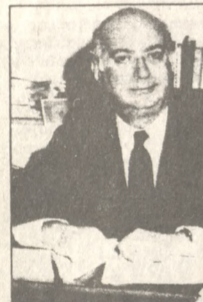
Ο Διοικητής της ΕΤΒΑ Καθηγητής Κωνσταντίνος Δρακάτος.