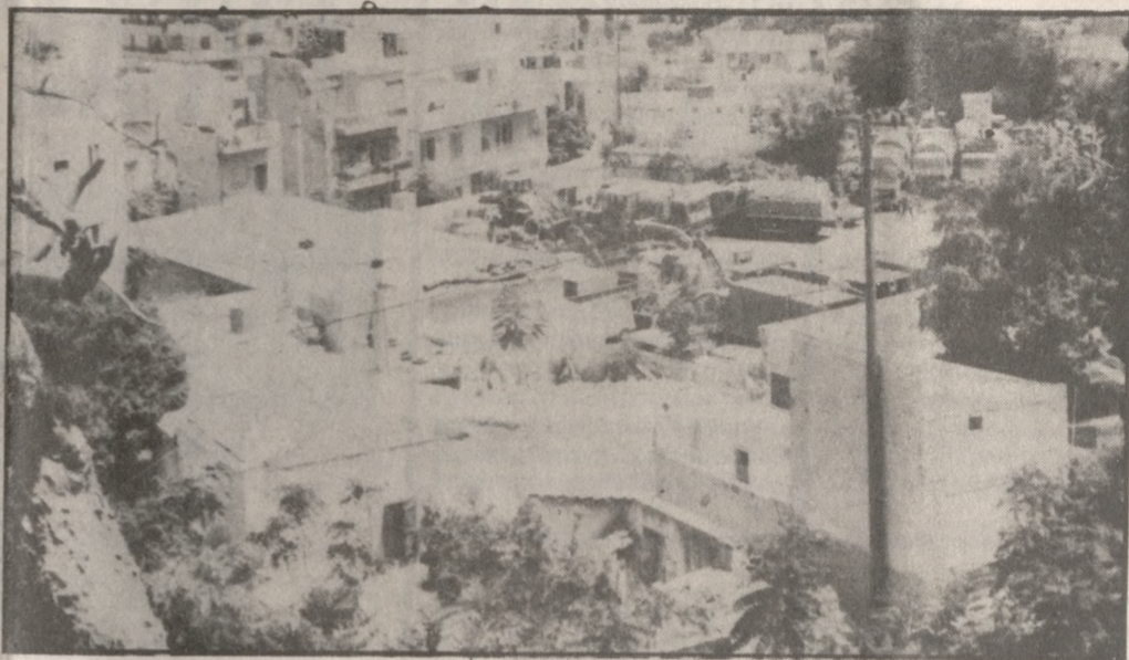
Ο χώρος όπου θα ανεγερθεί το νέο Πολιτιστικό Κέντρο

βοι Εθνικής Αντιστάσεως, κόμβος Μεσαράς και 62 Μαρτύρων μέχρι Ελευθέρας (10.000.000 δρχ.), η κατασκευή κτιρίων στεγασμού υπηρεσιών συνεργειών καθαριότητας κίνησης (130.000.000), εφαρμογή του σχεδίου πόλεως (300.000.000) δρχ. Ακόμη: Έργο περιφράξης Δημοτικών χώρων (2.000) 2.000.000 Έργο: κατασκευή και τοπο-