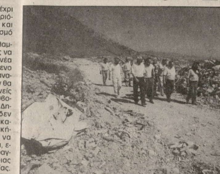
Μένοι, κόμματα και μεμονωμένοι δημότες, να υπονομεύουν το θεσμικό, κάθε έννοια συμπετοχής στα κοινά και το ίδιο μας το μέλλον.

Ποιο οδηγήθηκε από τη μέχρι πρόσφατα πολιτική καθαρότητας που ακολουθούσε, και ειδικότερα για τον κορεσμό της Σκαφιδάρδας.