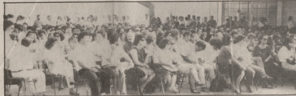
Σχεδόν ομόφωνα οι καθηγητές του Ηρακλείου στη χθεσινή γενική συνέλευση απέρριψαν την επιστράτευση τους από το υπουργείο

μικοί έκαναν την εμφάνισή τους κατά τη διάρκεια της Γενικής Συνέλευσης.