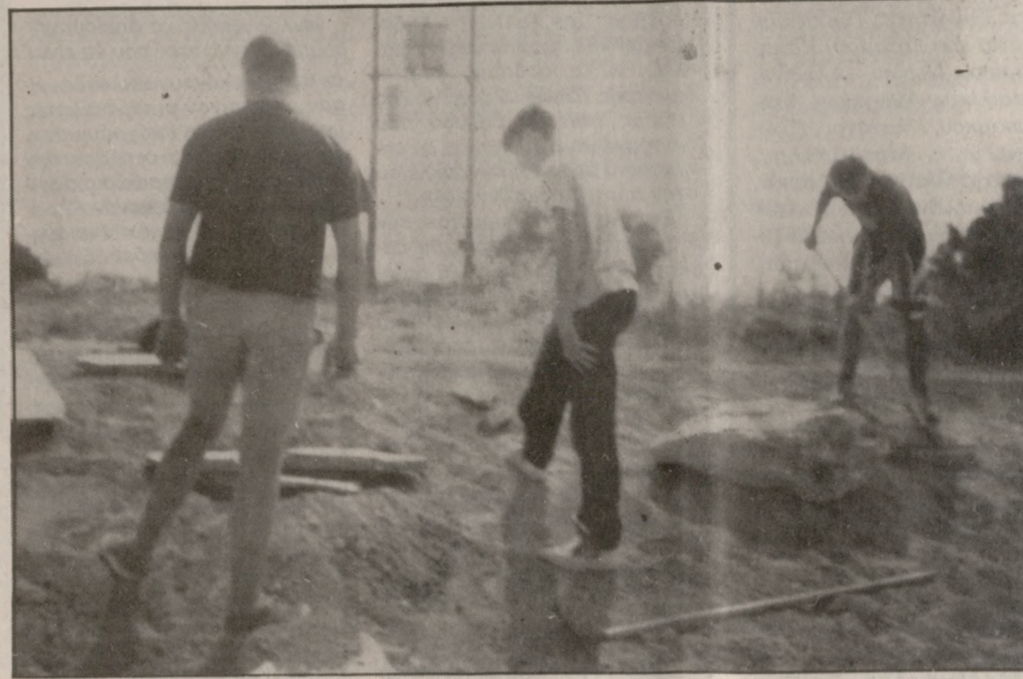
Ωρα εργασίας για τους σπουδαστές του Κέντρου Εκπαίδευσης.