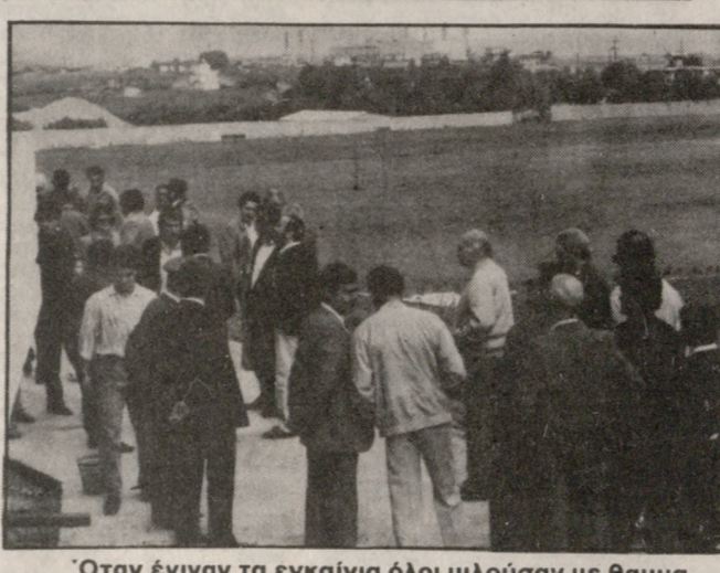
Όταν έγιναν τα εγκαίνια όλοι μιλούσαν με θαυμασμό για το στολίδι που λέγεται Βαρδινογιάννιο Αθλητικό Κέντρο. Τώρα η λειτουργία του είναι προβληματική λόγω των σκουπιδιών.

• ΜΕ το καθημέρα ένα τεράστιο πρόβλημα δημιουργήθηκε στην προετοιμασία των παικτών του ΟΦΗ. Δεν είναι βέβαια άγνωστο το πρόβλημα αυτό, αλλά θα λέγαμε ότι προϋπήρχε. Πρόκειται για τα σκουπίδια που βρίσκονται δίπλα από το Βαρδινογιάννιο Αθλητικό Κέντρο. Η φεβερρή δυσοσμία και οι μύγες δημιουργούν μια αφόρητη κατάσταση. Και σαν να μην έφταναν αυτά ο αέρας που φυσούσε χθες το πρωί μετέφερε στον αγωνιστικό χώρο σκουπίδια, ενώ η σκόνη έπνιγε τους ποδοσφαιριστές.