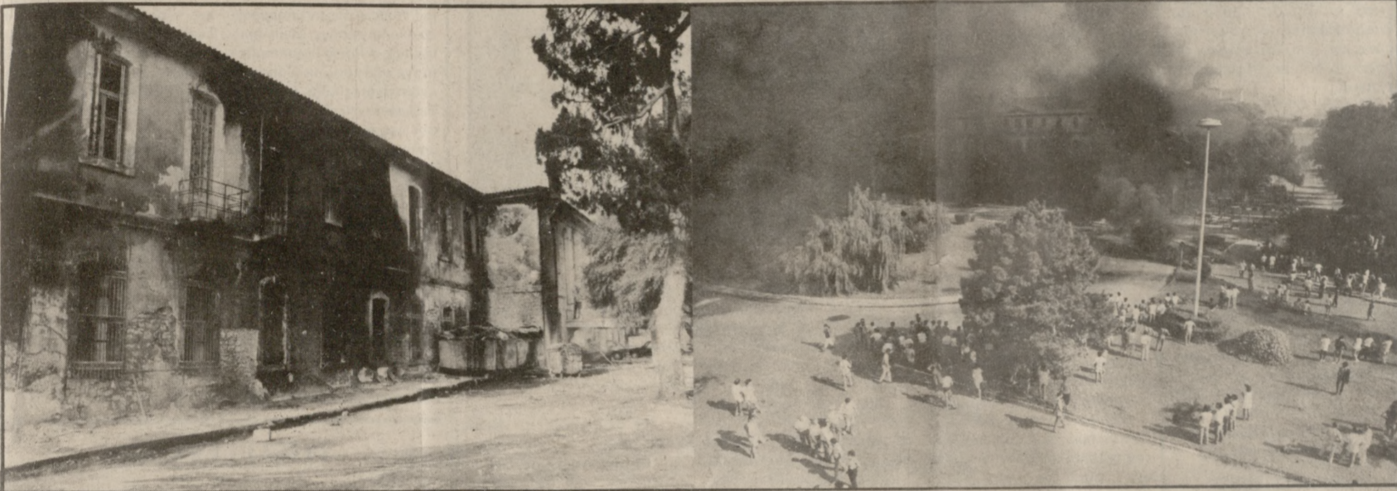
Φόρτισαν επικίνδυνα από χθες το πολιτικό κλίμα στην Ελλάδα τα γεγονότα στα Χανιά. Με χθεσινές δηλώσεις η Κυβέρνηση υποστηρίζει ότι "ξένα στοιχεία πρωτοστάτησαν στα γεγονότα. Αντίθετα η Αντιπολίτευση καταγγέλλει την Κυβέρνηση για απροσχημάτιστη επίθεση σε βάρος των διαδηλωτών. Στο μεταξύ οι ζημιές από τα επεισόδια στα Χανιά φαίνεται να ξεπερνούν τα 400 εκατομμύρια δραχμές.

Η ΡΕΜΙΑ επικράτησε χθες στην πόλη των Χανιών μετά τα σοβαρά προχθεσινά επεισόδια. Χθες, στην πλατεία της αγοράς πραγματοποιήθηκε ανοικτή συγκέντρωση διαμαρτυρίας κατά των Ξένων Βάσεων, ενώ ακολούθησε πορεία προς τη Νομαρχία όπου αντιπροσωπεία των διαδηλωτών επέδωσε ψήφισμα διαμαρτυρίας στον Περιφερειάρχη Κρήτης Γιώργο Σενετάκη ο οποίος βρισκόταν εκεί από το πρωί.