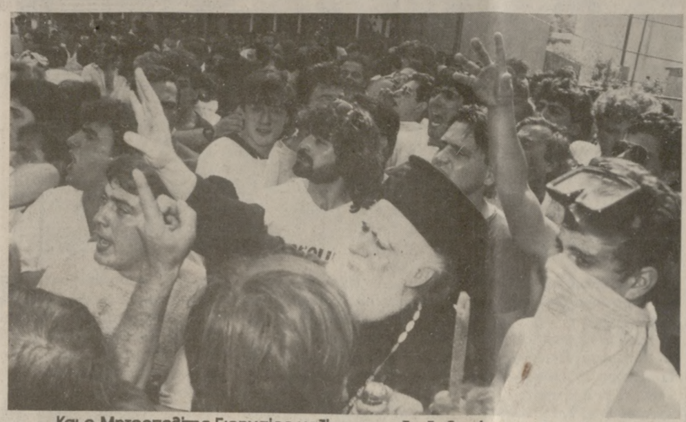
Και ο Μητροπολίτης Ειρηναίος μαζί με τους διαδηλωτές στη χθεσινή ειρηνική συγκέντρωση.

τικής Επιτροπής του Συνσπισμού τονίζεται: Η πολιτική Επιτροπή Ηρακλείου του Συνσπισμού καταδικάζει με τον πιο έντονο και κατηγορηματικό τρόπο την πρωτοφανή επίθεση των ΜΑΤ εναντίον στους Χανιώτες, τη στιγμή που αντιπροσωπεύει τους πηγαινε να επιδώσει ψήφισμα στο Νομάρχη. Η επίδειξη αυταρχισμού από μεριάς της Κυβέρνησης προκαλεί τα φιλεργνητικά δημοκρατικά αισθήματα των Ηρακλειωτών και δεν πρόκειται να κάμψει τα αντιβασικά τους φρονήματα. Καλούμε τους Ηρακλειώτες και τις Ηρακλειώτισσες, τους μαζικούς φορείς του Νομού να καταδικάσουν την ταχική της κυβέρνησης με όποιο τρόπο κρίνουν σκόπιμο. Δηλώνουμε ότι θα συνεχίσουμε και θα συμβάλλουμε με μεγαλύτερη ένταση στον αγώνα για την απομάκρυνση των βάσεων από την χώρα μας. ΟΙ ΟΙΚΟΛΟΓΟΙ ΕΝΑΛΛΑΚΤΙΚΟΙ Από την Κίνηση Ηρακλείου των Οικολόγων Εναλλακτικών εκδόθηκε η παρακάτω ανακοίνωση: Τα γεγονότα των Χανίων πρωτοφανή για την έκταση και την αγριότητα των συ-