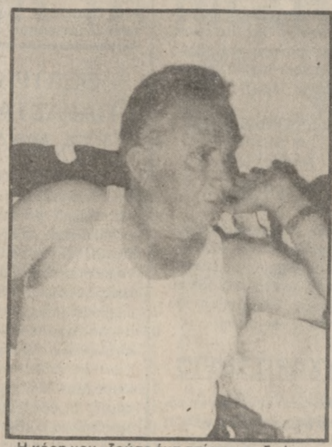
Η κόρη μου «ζούσε ένα άπιστευτο δράμα λέει ο τραγικός πατέρας του θύματος