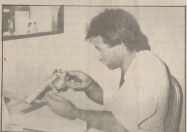
Αξιωματικός της Ασφάλειας περιεργάζεται το ολοκαίνουργιο πανόκριβο και δυσεύρετο Μάγκνουμ του δολοφόνου