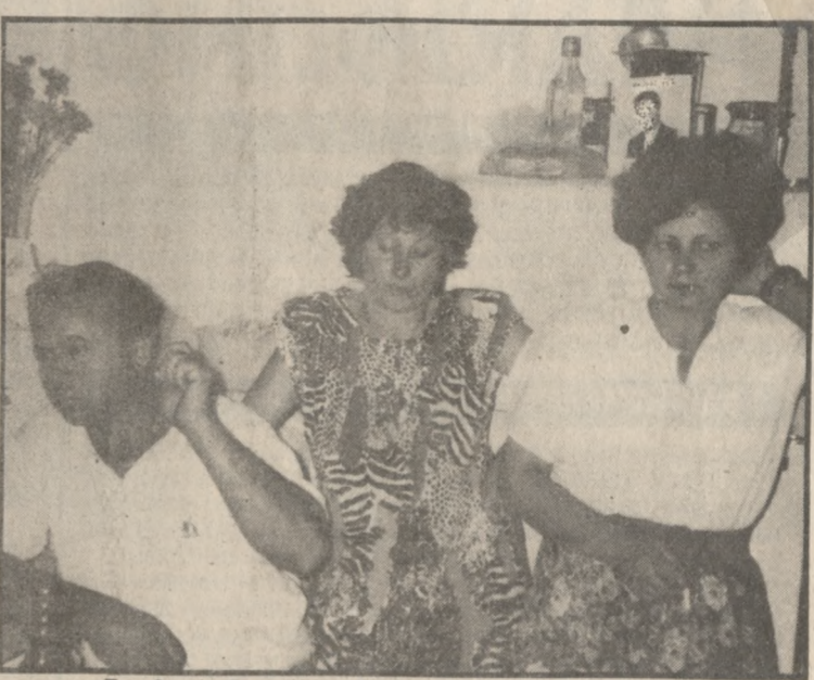
Την βασάνιζε χρόνια ολόκληρα ώσπου την σκότωσε λένε οι συγγενείς του θύματος

Με τη μοναδική γυροπλοία του επαγγελματία εκτελεστή, εκτέλεσε εν γυχνώ την γυναίκα του μέσα στο σπίτι πατώντας έξι φορές την σκανδάλη του «μάγκνουμ» που τράπηξε από το συρτάρι του κομοδί-