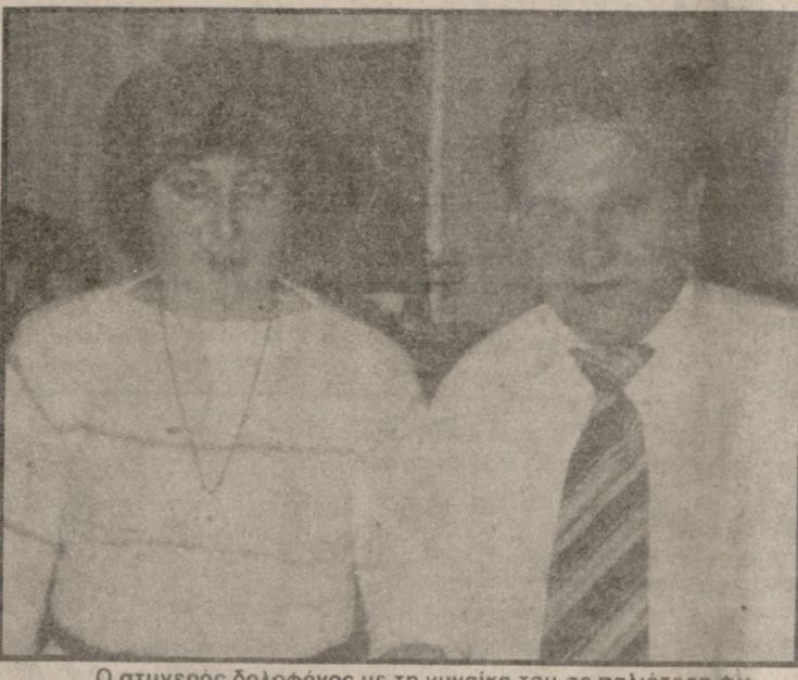
Ο στυγερός δολοφόνος με τη γυναίκα του σε παλιότερη φωτογραφία